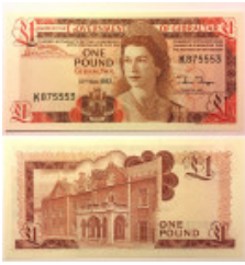
673 GIBRALTAR. 1 Pound 1983 Pick 20c, kassenfrisch (UNC)