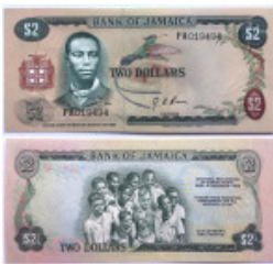
676 JAMAICA. 2 Dollars 1973, FAO Pick 58, kassenfrisch (UNC)