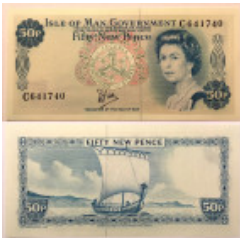
675 INSEL MAN. 50 New Pence o.J.(1979) Pick 33a, kassenfrisch (UNC)