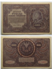
677 POLEN. 1000 Mark 23.8.1919, Kosciuszko, 1. Serie Pick 29, II (XF)