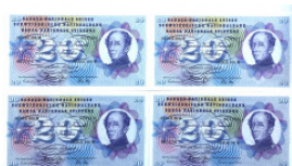
679 SCHWEIZ. 4 x 20 Franken 7.2.1974, 5. Serie, General Dufour Pick 46v, kassenfrisch (UNC)