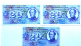
678 SCHWEIZ. 3 x 20 Franken 10.2.1971, 5. Serie, General Dufour Pick 46s, kassenfrisch (UNC)