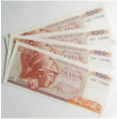
674 GRIECHENLAND. 4 x 100 Drachmen 8.12.1978, fortlaufende Nummern! Pick 200a, kassenfrisch (UNC)