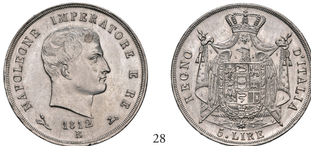
28 Napoleone I re d'Italia (1805-1814) . Da 5 lire 1812 AG. Pagani 51a. Chimienti 1203. MIR 62/7. Rara. SPL 350