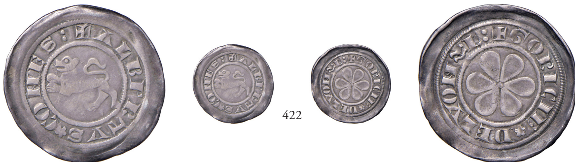
422 Alberto II conte (1258-1304) . Denaro 1271-1304 AG gr. 0,95. Rizzolli L31. MIR 106. Molto raro. Buon BB 300