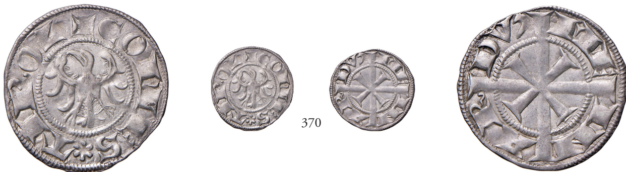
370 Grosso tirolino 1274-1306 (7° contrassegno) AG gr. 1,65. CNTM M108. Raro e particolarmente ben conservato, SPL 200