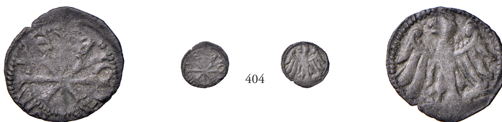
404 Denaro o berner MI gr. 0,25. CNTM M502a.

Della più esimia rarità, probabilmente il terzo esemplare noto. Buon BB 1.250