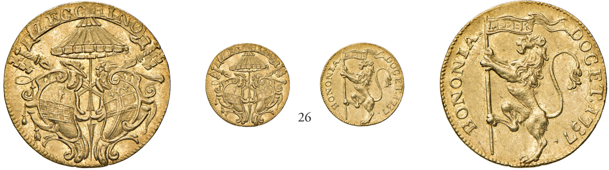
26 Clemente XII (1730-1740) . Zecchino 1737 (armetta Spinola) AV gr. 3,47. Muntoni 167. Berman 2674. Chimienti 820. MIR 2535/1 (questo esemplare illustrato). Della più grande rarità. SPL 8.000 Ex asta Varesi 69/2016, ANPB parte II, 998.