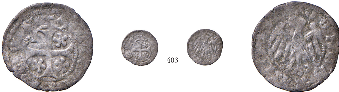
403 Quattrino MI gr. 0,48. CNTM M499.