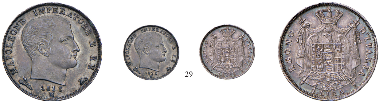
29 Lira 1813 AG. Pagani 60a. Chimienti 1217. MIR 64/5. Molto rara. Patina di medagliere iridescente, q.FDC 250