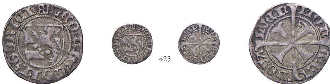
425 Leonardo conte (1462-1500) . Grosso tirolino AG gr. 0,86. Rizzolli L142. MIR 130 var. Di buona qualità per il tipo di moneta, q.SPL 200