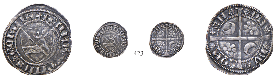
423 Enrico III conte (1342-1363) . Denaro AG gr. 0,74. Rizzolli L69. MIR 121. Molto raro. q.SPL 750 Ex asta Gorny & Mosch 205/2012, 4171.