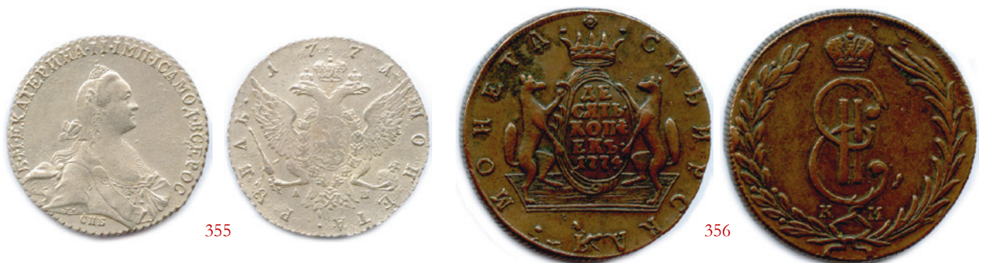
355 RUSSIE - CATHERINE II 1762-1796 Rouble d'argent 1771 Saint Petersburg. (23,40 g) ♦ Dav 1684

Trace de nettoyage. Très beau. 150 / 180 €