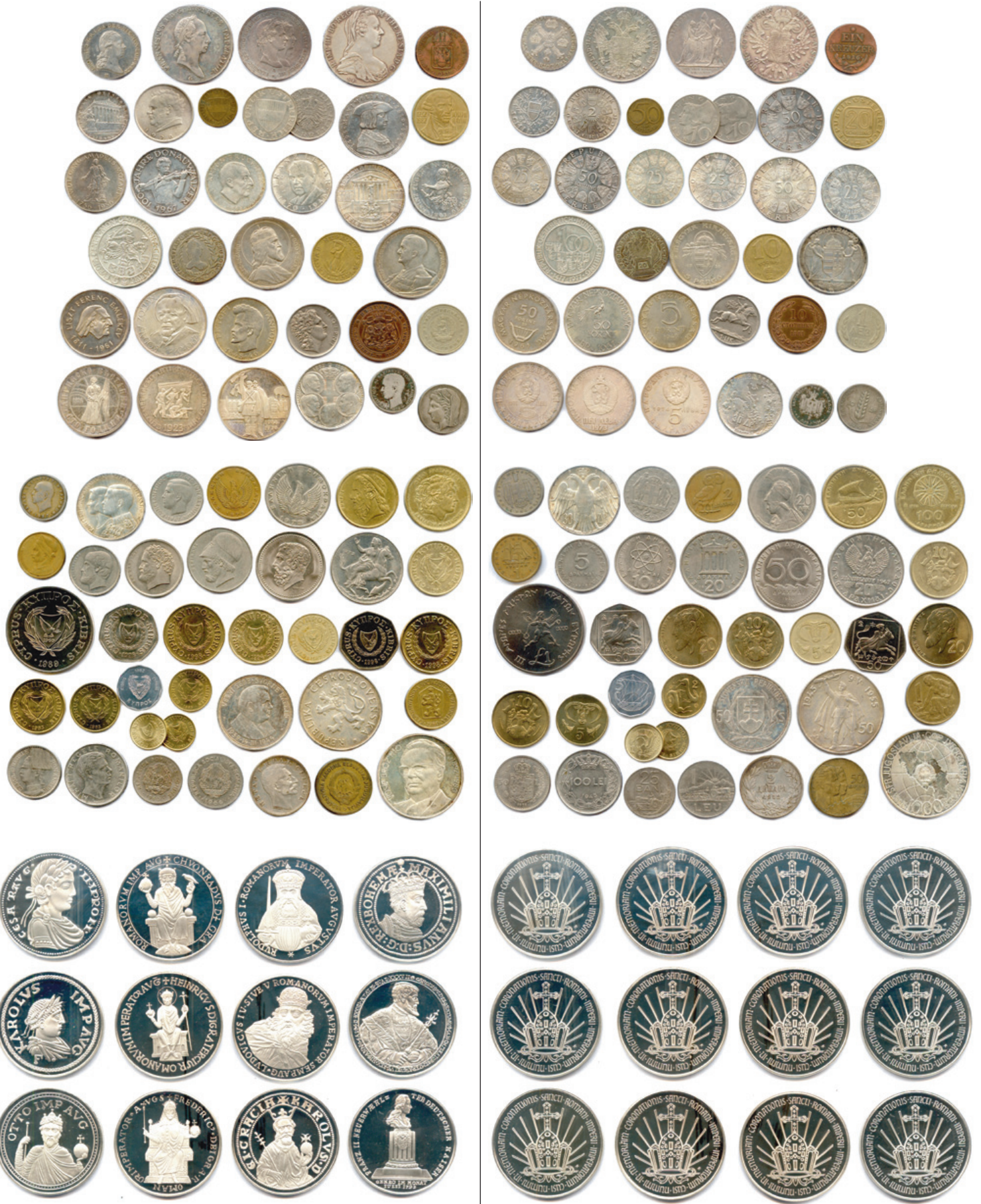
381 Lot de 84 pièces modernes en argent et autres métaux : Autriche, Grèce, Chypre, Bulgarie, Roumanie, Tchecoslovaquie, Yougoslavie. Beaux. T.B. Très beaux. Superbes. 300 / 350 €