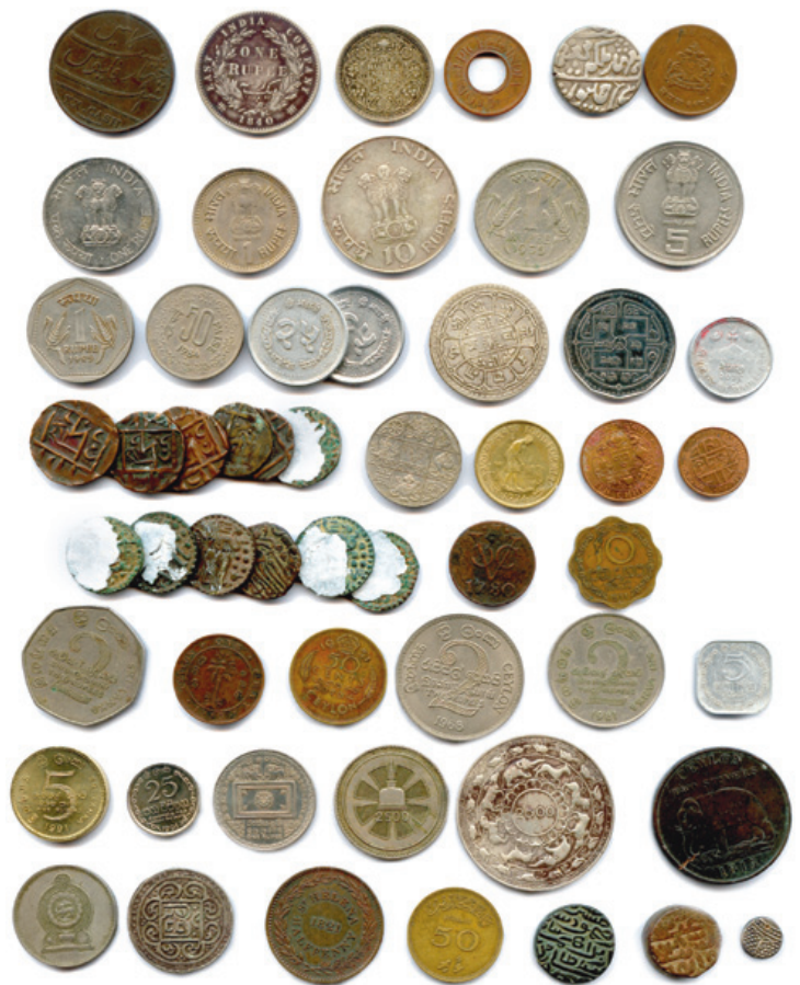
443 PAYS d'ASIE Lot de 55 monnaies en argent, nickel, alu et divers métaux : Cie des Indes anglaises, Jaipur, Inde Ganghi, Népal, Tibet, Bhutan, Ceylan, Sri Lanka, Saint Hélène, Pondichery.

B. Beaux. T.B. Très beaux. Superbes. 200 / 220 €