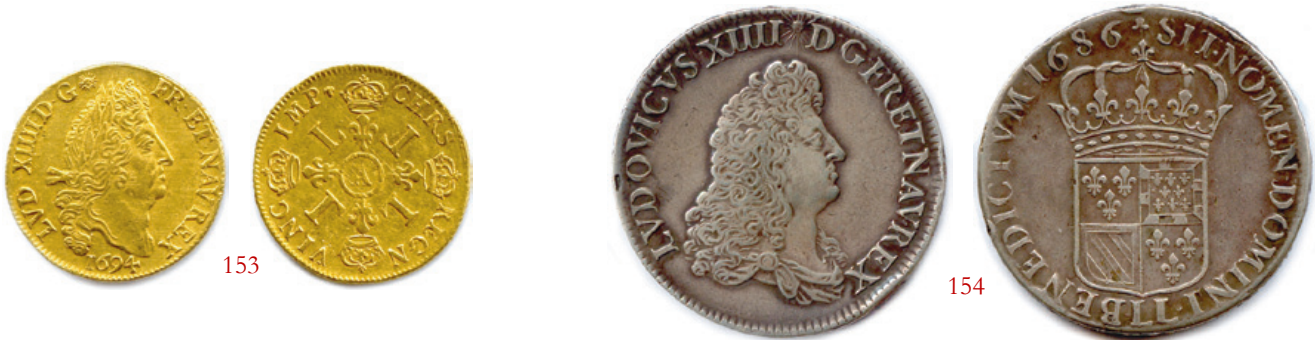
153 LOUIS XIV 1643-1715 Double-louis d'or aux Quatre L 1694 A = Paris. (13,46 g) ♦ Dy 1439 ; Fr 432

Chevelure retouchée. Très beau. 2 500 / 2 800 €