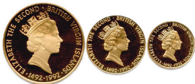
416 (3 p.)