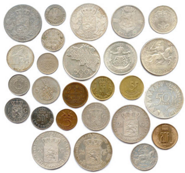
380 Lot de 25 pièces modernes en argent et autres métaux : Belgique, Luxembourg, Pays-Bas. Beaux. T.B. Très beaux. Superbes. 150 / 180 €