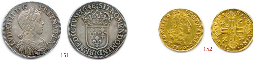
151 LOUIS XIV 1643-1715 Demi-écu d'argent à la mèche longue 1648 K = Bordeaux. (13,60 g) ♦ Dy 1469