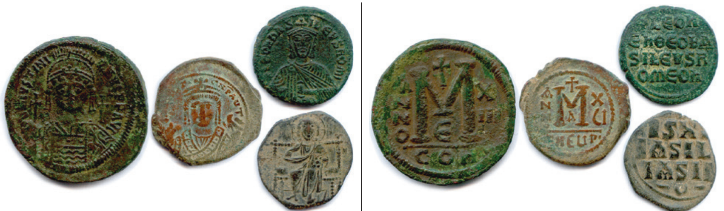
104 Quatre monnaies byzantines : Follis et demi-follis en bronze de Justinien I er (527-565) Constantinople, de Maurice Tibère (582-602) Antioche/Theoupolis, de Léon VI (886-912) Constantinople et de Constantin IX (1042-1055) Constantinople. B. T.B. et Très beau. 50 / 60 €