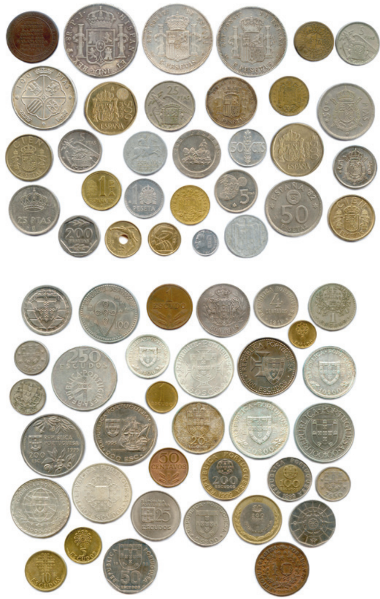
379 Lot de 64 pièces modernes en argent et autres métaux : Espagne, Portugal, Açores. Beaux. T.B. Très beaux. Superbes. 100 / 120 €