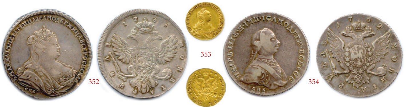
352 RUSSIE - ANNE IVANOVNA 1730-1740 Rouble d'argent 1738 Saint Petersburg. (25,88 g) ♦ Dav 1675