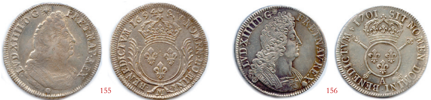
155 LOUIS XIV 1643-1715 Écu d'argent aux Palmes 1694 M = Toulouse. (27,00 g) ♦ Dy 1520A

Chevelure retouchée. Très beau. 500 / 550 €