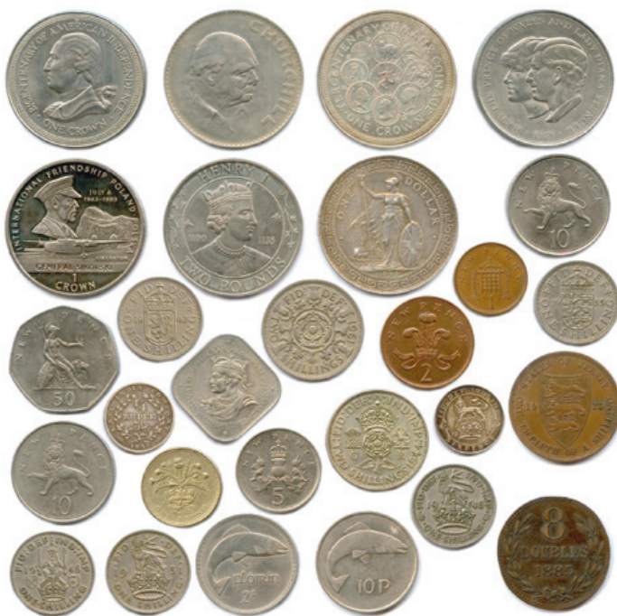
377 Lot de 28 pièces modernes en argent et divers métaux : Angleterre, Jersey, Guernesey, Irlande.