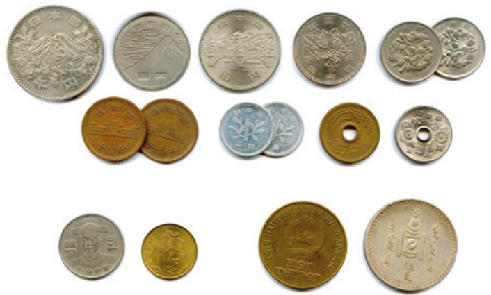
442 PAYS d'ASIE Lot de 16 monnaies en nickel, alu et divers métaux : JAPON, CORÉE du Nord et du Sud, MONGOLIE.