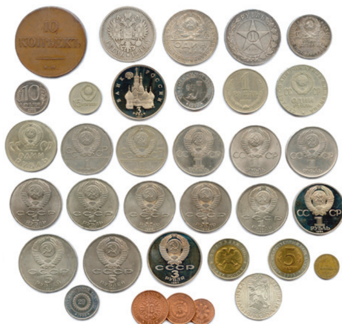
378 Lot de 34 pièces modernes en argent et autres métaux : Russie et URSS.

Beaux. T.B. Très beaux. Superbes. 50 / 60 €