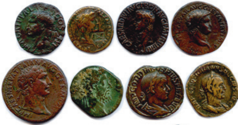
102 Huit monnaies romaines en bronze : Agrippa, Auguste, Caligula, Néron, Trajan, Commode, Gordien et Trajan Dèce. Beaux. T.B. Très beaux. 250 / 300 €