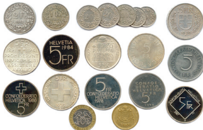
376 Lot de 20 pièces modernes en argent et divers métaux : Suisse, Monaco.