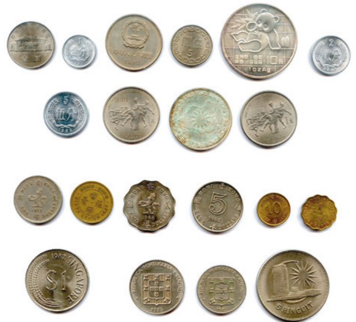
441 PAYS d'ASIE Lot de 20 monnaies en argent, nickel, alu, laiton : CHINE 10 pièces ; HONG KONG 6 pièces ; SINGAPOUR 1 pièce ; MACAO 2 pièces ; MALAISIE 1 pièce.