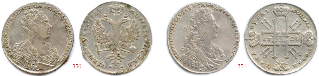
350 RUSSIE - CATHERINE I ère 1725-1727 Rouble d'argent 1727. (28,28 g) ♦ Dav 1665