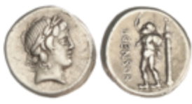
61 85 €