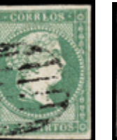
1110 50 €