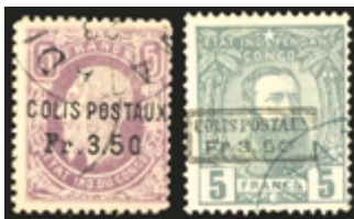
2179 50 €