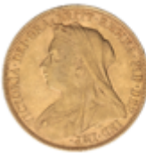
784 375 €