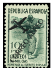
1455 20 €