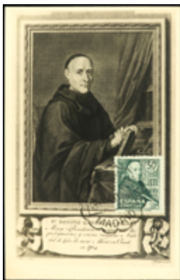
1556 30 €