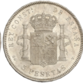
567 70 €