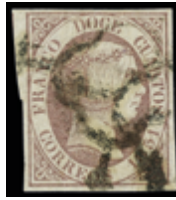
1069 30 €