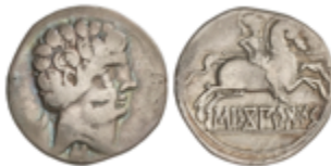
28 50 €