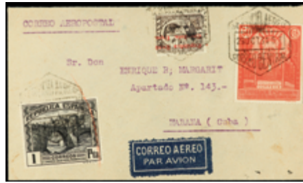
1325 80 €