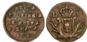
313 200 €