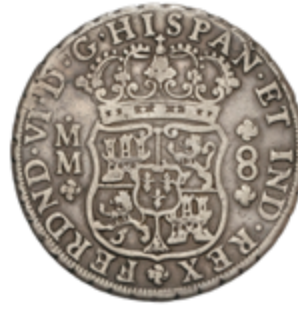
251 120 €