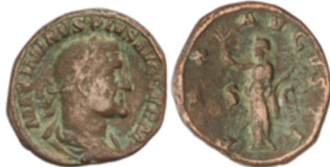
126 50 €