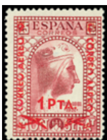
1440 40 €