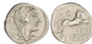
73 60 €