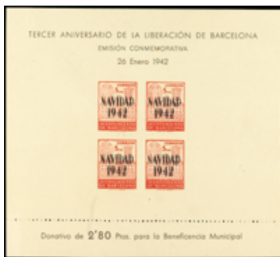
1735 40 €