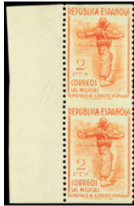
1454 80 €