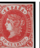
1121 75 €