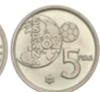
637 70 €