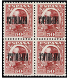
1805 45 €