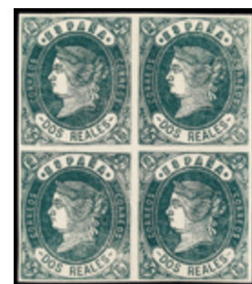
1126 30 €