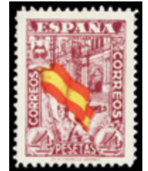
1461 65 €