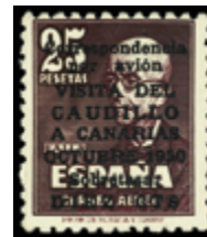
1597 125 €