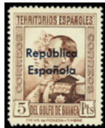
2048 25 €