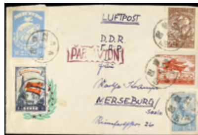
2228 50 €