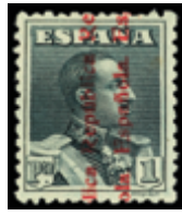
1323 85 €