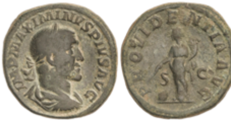
127 50 €