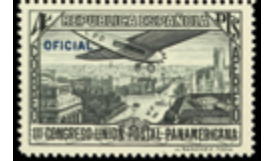
1341 30 €