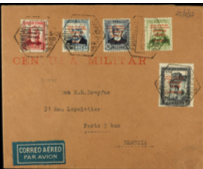
1830 50 €