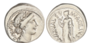
41 70 €