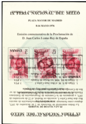
1711 80 €