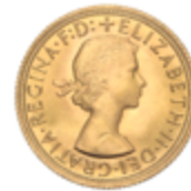
786 350 €