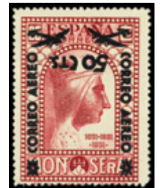
1438 35 €