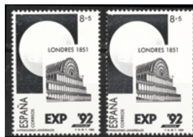
1659 40 €