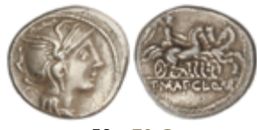
58 70 €