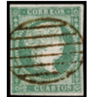
1112 50 €