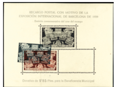
1745 30 €