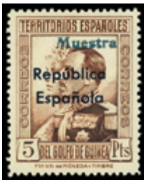
2047 40 €