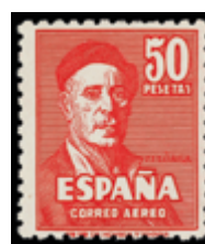
1563 35 €