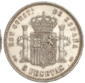
552 40 €