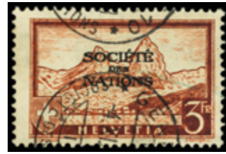
2461 90 €