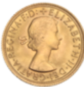
787 350 €