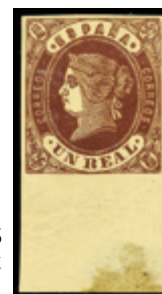
1125 30 €