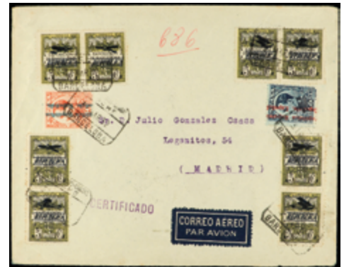
1721 80 €