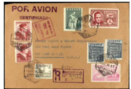
1559 30 €