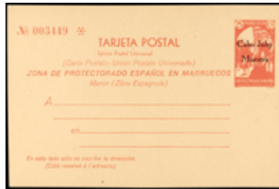
2012 85 €