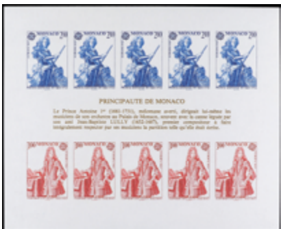
2400 20 €