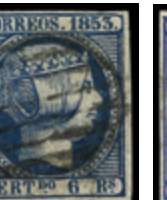
1095 95 €