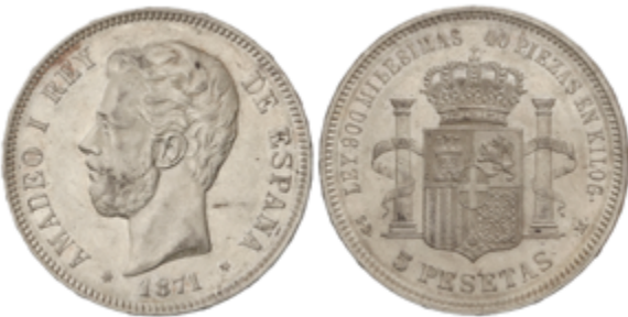
464 150 €