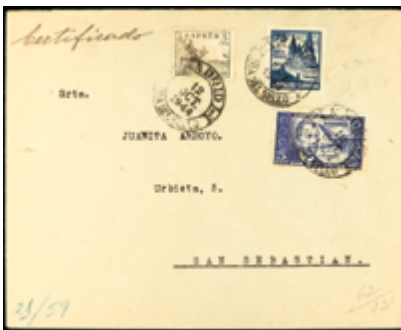
1552 30 €