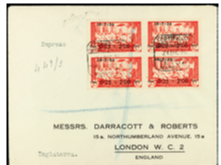
2064 120 €