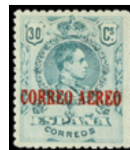
1251 50 €