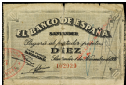
919 75 €