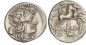
60 100 €