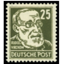
2143 45 €