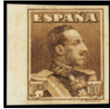
1255 60 €