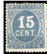
1237 60 €