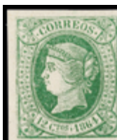
1131 20 €