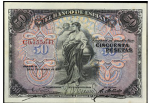
901 55 €