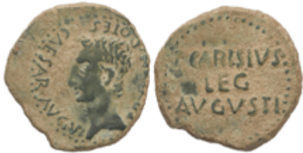
15 50 €