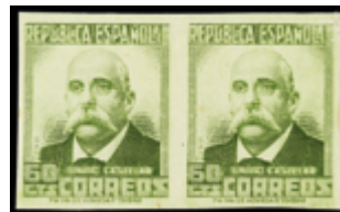
1351 25 €