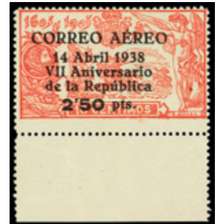
1400 30 €