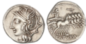
43 85 €