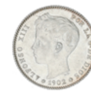
537 100 €