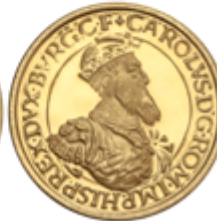
701 725 €