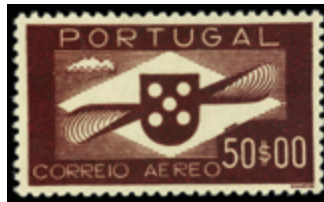
2431 90 €