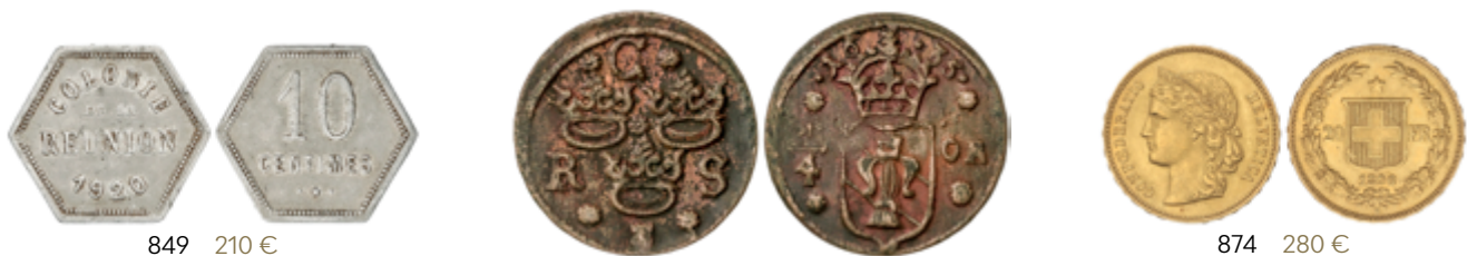
849 210 €