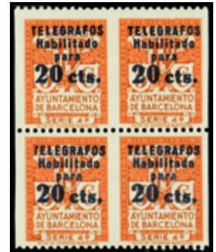
1757 18 €