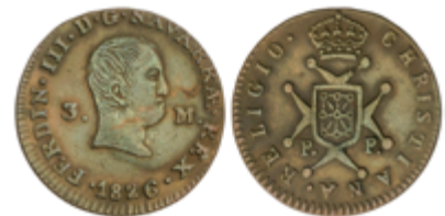
329 50 €