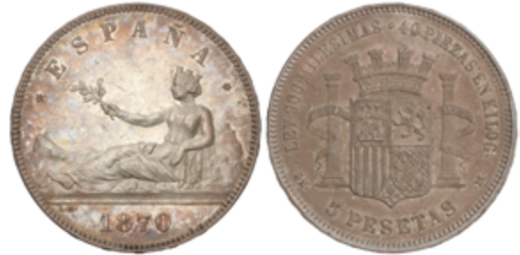
460 80 €