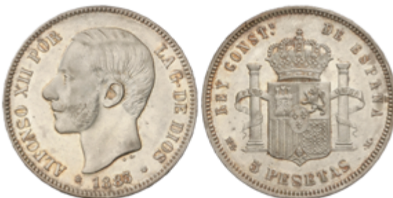
493 350 €