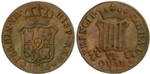
297 75 €