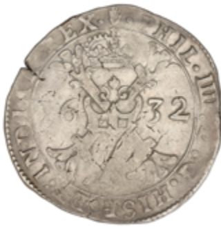
232 50 €