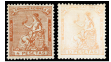
1200 180 €