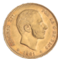
514 375 €