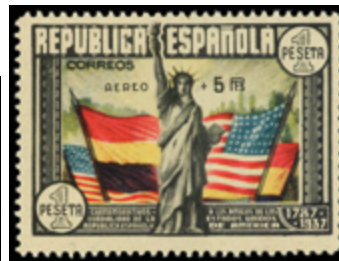
1416 80 €