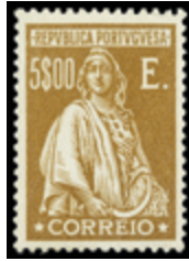
2421 30 €