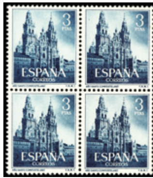
1627 70 €