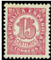
1393 30 €