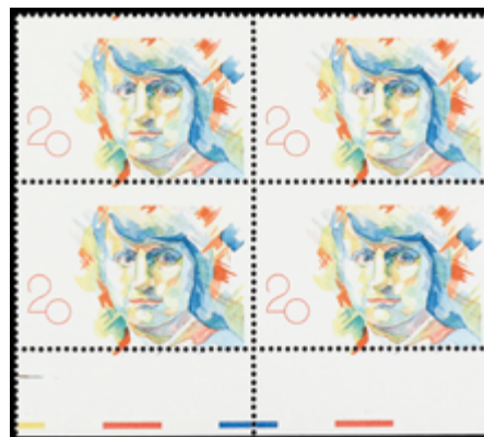
1654 60 €