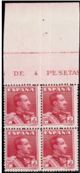
1256 95 €