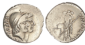
48 95 €