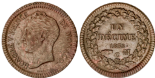
830 120 €