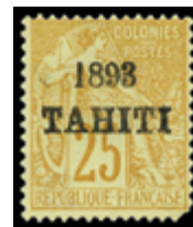
2300 400 €