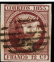
1090 55 €