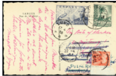
1542 30 €