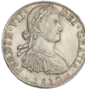
396 60 €