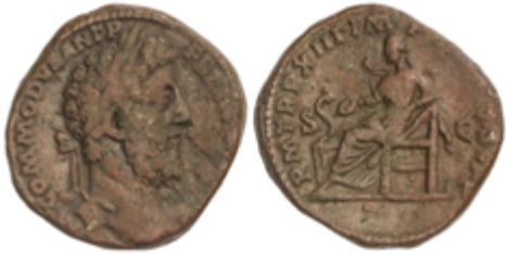
108 50 €