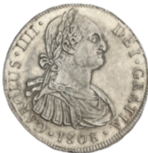
273 60 €