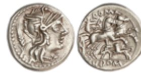
49 100 €