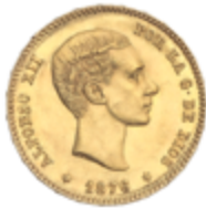
504 375 €