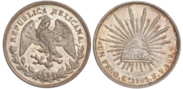
818 100 €