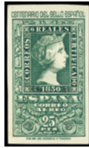
1583 30 €