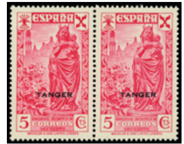
2096 25 €