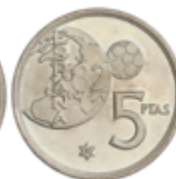
636 90 €