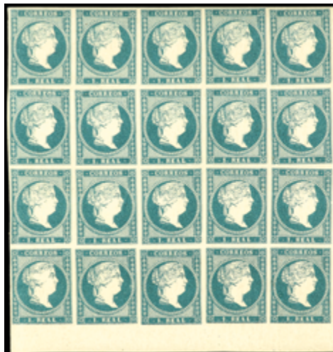
1115 80 €