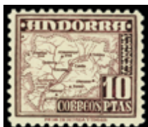
2000 20 €