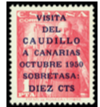
1588 40 €