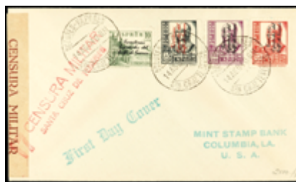
2050 25 €