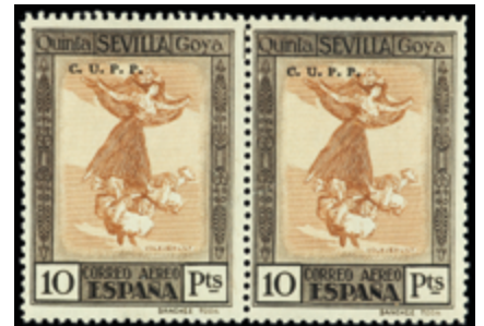
1294 20 €