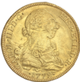
265 1200 €