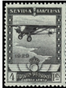
1271 20 €