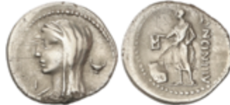
44 65 €