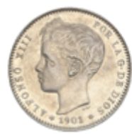
536 60 €