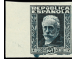
1353 20 €