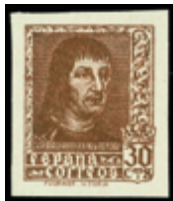
1489 60 €