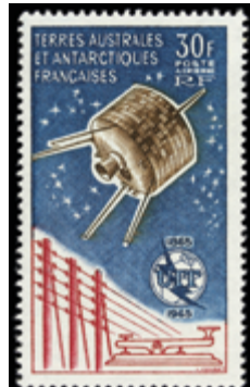
2299 24 €