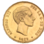
506 350 €