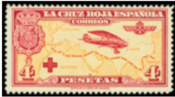
1260 30 €