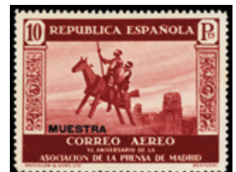
1376 15 €