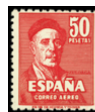
1564 55 €