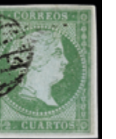
1108 30 €