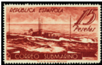
1430 100 €