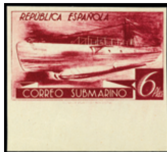
1434 30 €