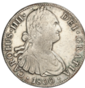
275 50 €