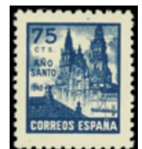
1549 20 €