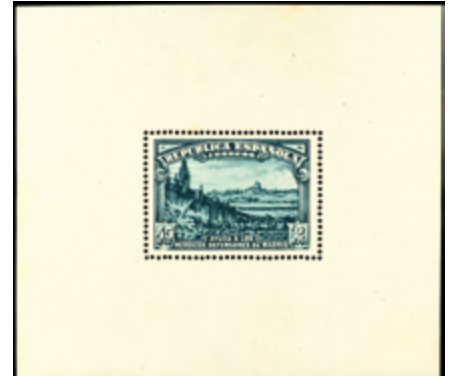
1406 150 €