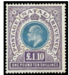
2326 40 €