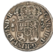
260 50 €