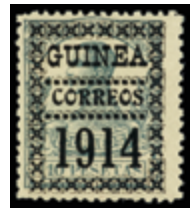
2043 100 €