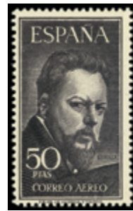
1622 200 €