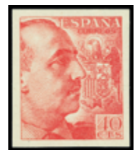
1533 100 €