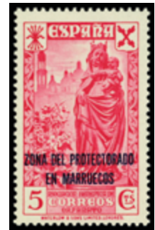
2065 35 €