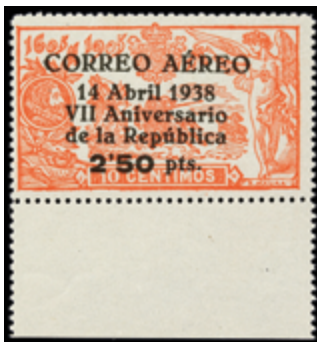
1401 30 €