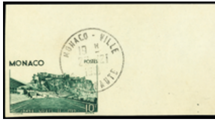
2397 30 €