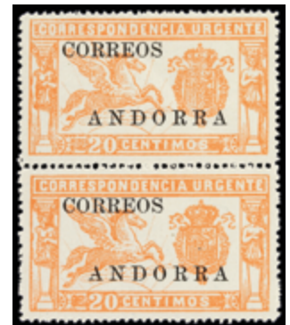
1993 25 €