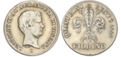
808 75 €