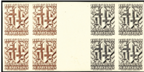
1760 50 €