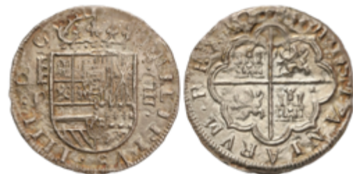
231 60 €