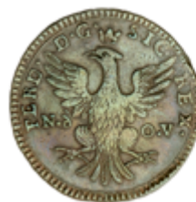
797 90 €