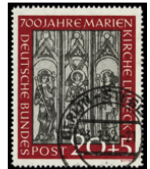
2131 45 €