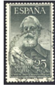
1623 20 €