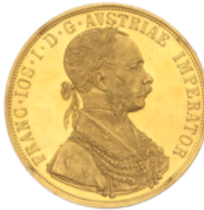
698 700 €