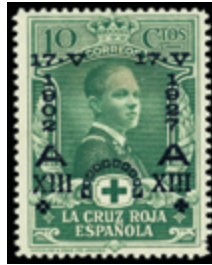
1262 50 €