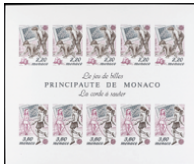
2402 12 €