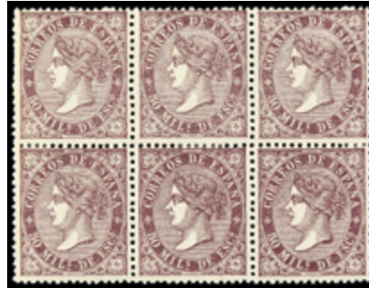
1182 50 €