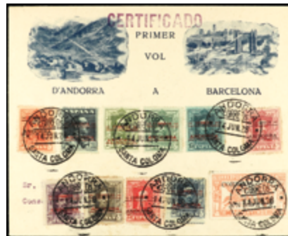
1992 50 €