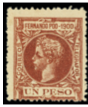
2030 25 €