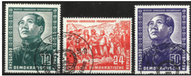
2142 20 €