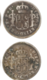
266 50 €