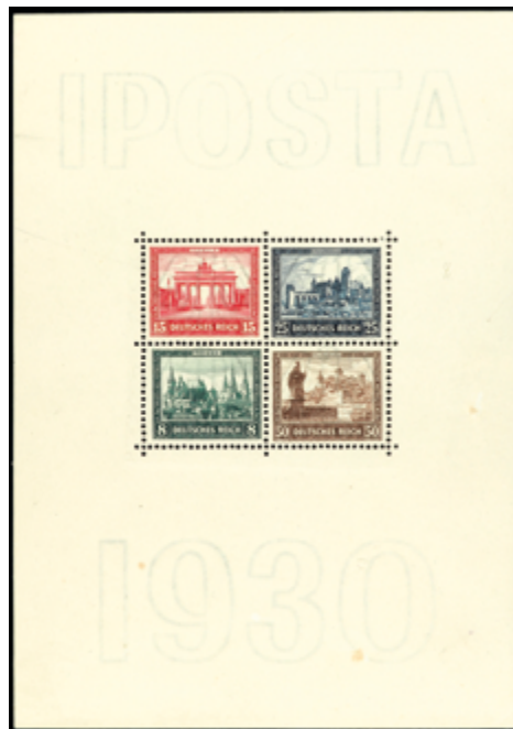
2124 150 €