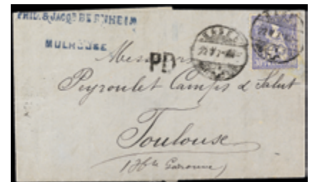
2452 50 €