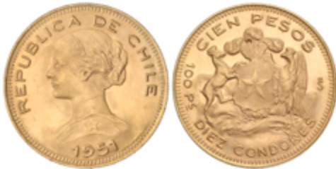
706 925 €