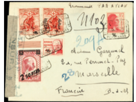
1419 80 €