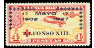
1258 50 €