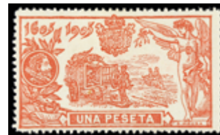
1243 75 €