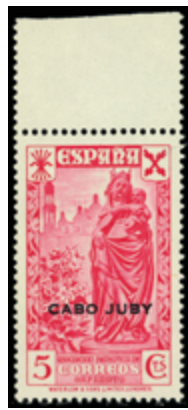
2010 18 €