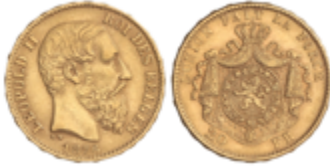
700 300 €