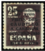
1599 60 €