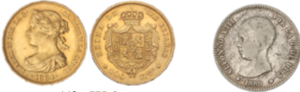
442 375 €