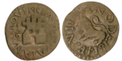
306 50 €