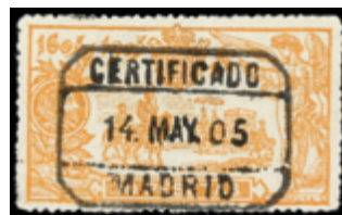
1245 90 €