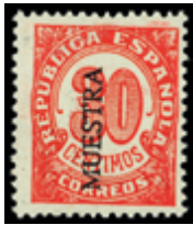
1392 45 €