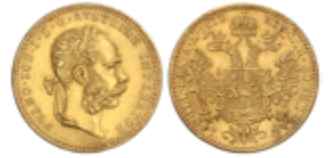
697 140 €