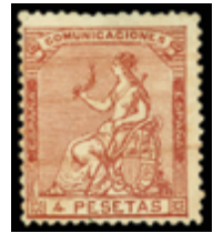
1201 45 €