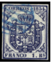
1106 75 €