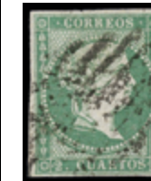
1111 50 €