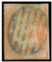
1086 300 €