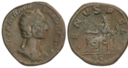
122 60 €