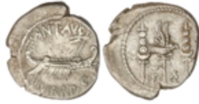
81 60 €