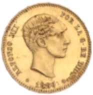
508 375 €