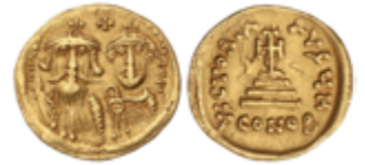
166 300 €