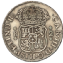
258 80 €