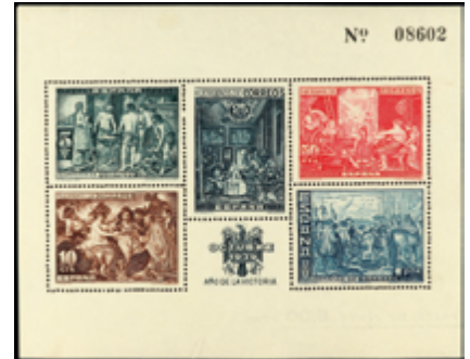
1776 20 €