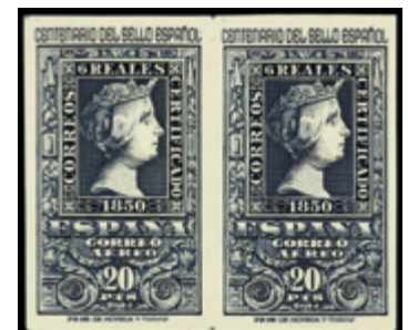
1577 225 €