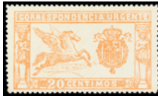
1257 10 €