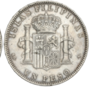
575 50 €