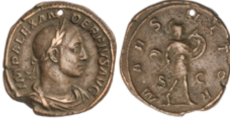
119 50 €