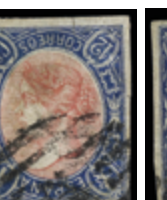
1140 75 €