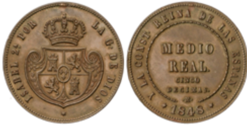
424 50 €