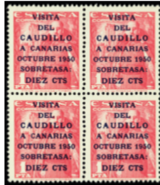
1594 140 €