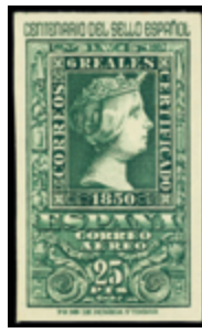
1578 70 €