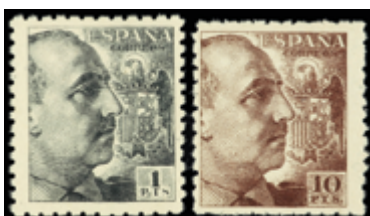
1521 95 €