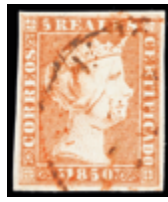
1063 75 €