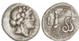
74 80 €