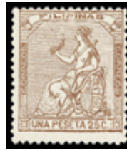
2035 30 €