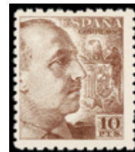
1522 40 €