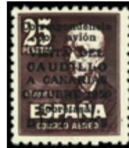
1596 140 €