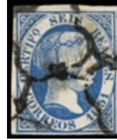
1077 250 €