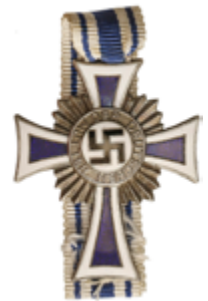
987 50 €