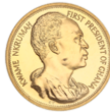
779 800 €