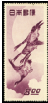
2366 20 €