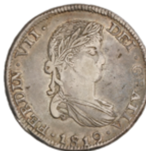
400 60 €