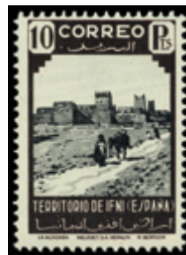
2058 20 €