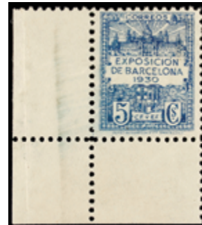
1720 15 €