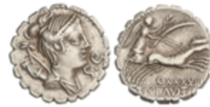
45 50 €