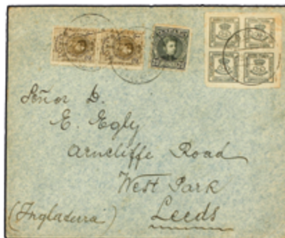
1239 65 €