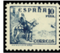
1473 35 €