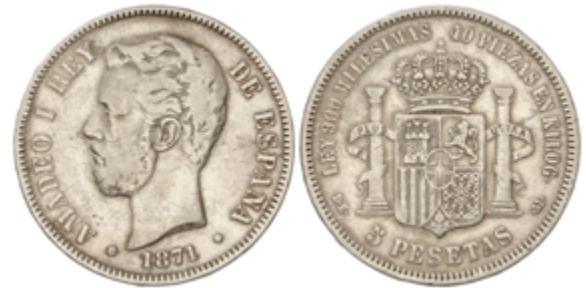
471 210 € .jpg