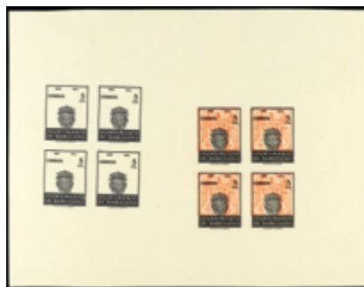
1742 25 €