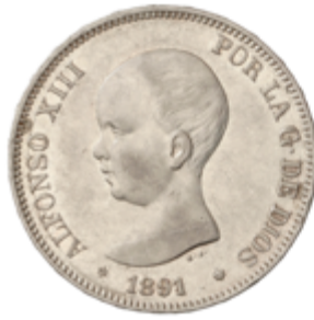
548 60 €