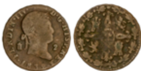
321 50 €