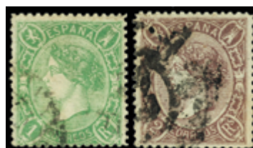
1149 40 €