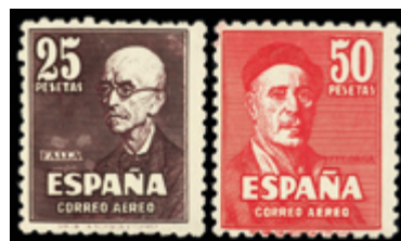
1562 60 €