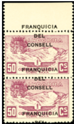
1997 25 €