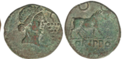
24 50 €