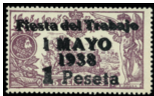
1410 50 €