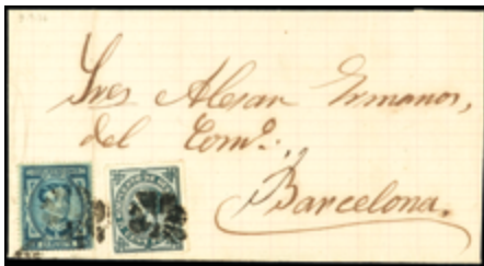
1220 40 €