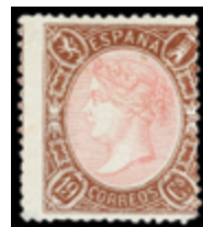
1147 100 €