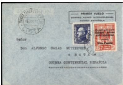
2051 25 €