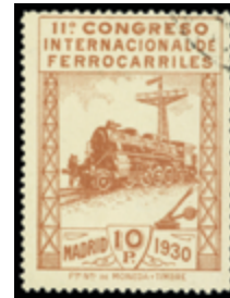
1282 130 €