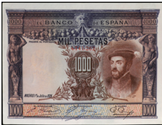
917 110 €