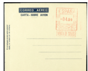
1793 40 €