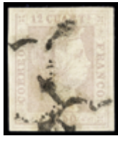
1060 40 €