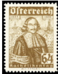
2161 20 €