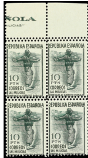
1456 48 €