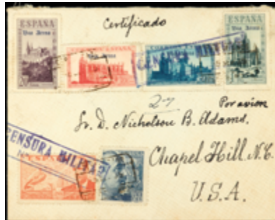
1513 30 €