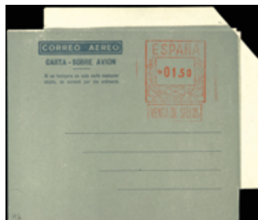
1791 25 €