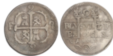
365 90 €