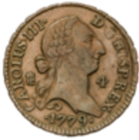
253 55 €