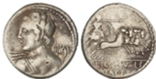
55 40 €