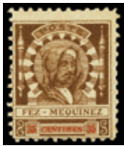
2271 125 €