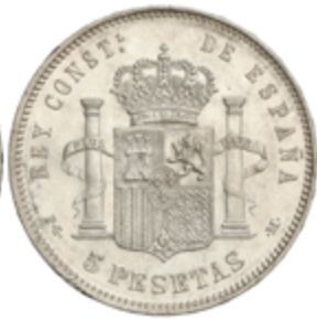
549 60 €