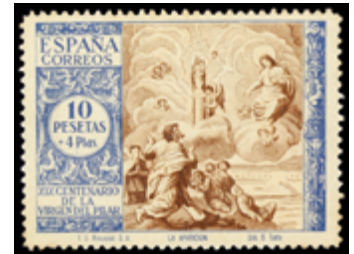
1518 50 €