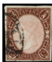
1144 100 €