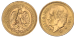
828 200 €