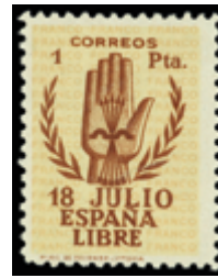
1502 30 €