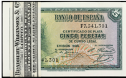
905 150 €