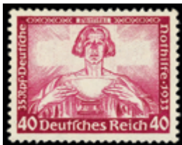
2122 70 €