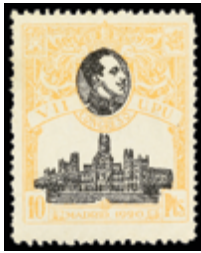
1253 125 €