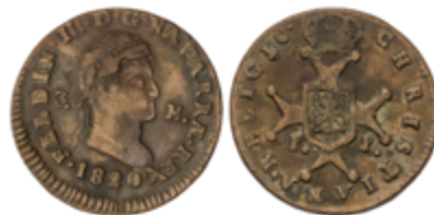
324 75 €