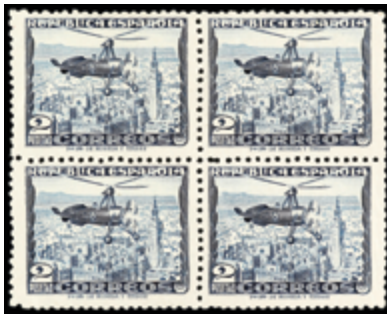
1368 30 €