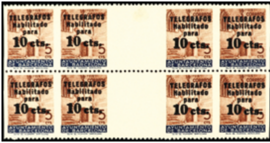
1751 30 €