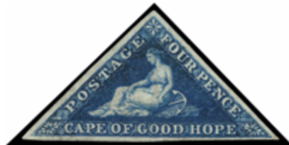
2318 50 €