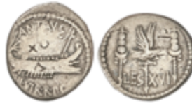
82 115 €