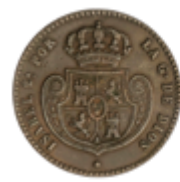
423 90 €