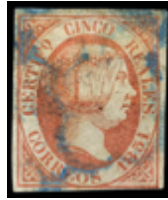
1075 50 €