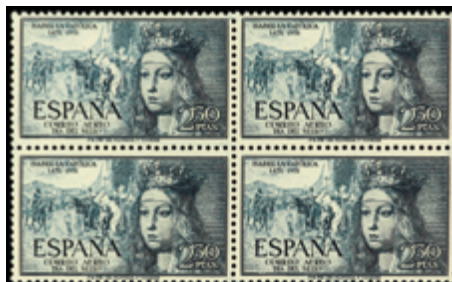
1609 25 €