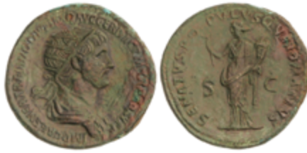
89 100 €