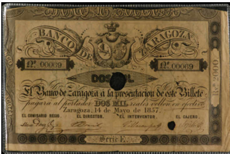
898 60 €