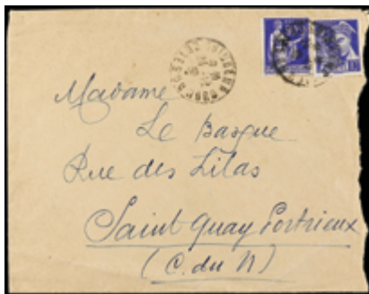
1816 30 €