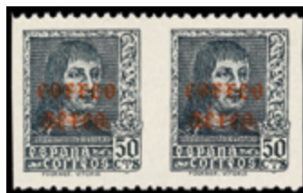
1497 20 €