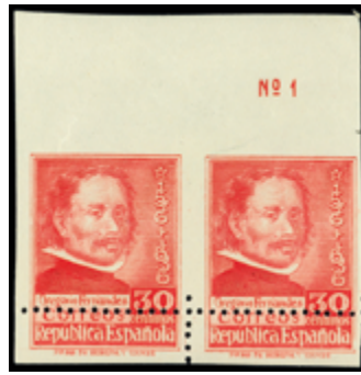
1381 20 €