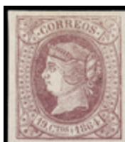
1132 70 €