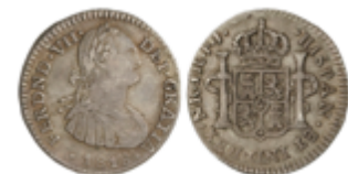
356 60 €