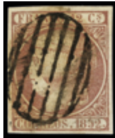
1085 30 €