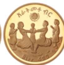
758 800 €