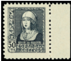
1504 25 €