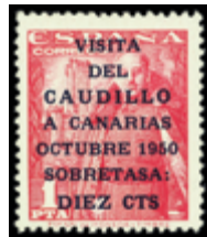
1590 45 €