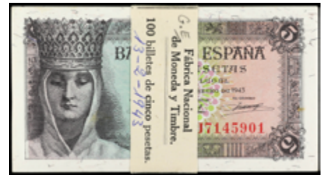
935 500 €