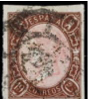
1142 150 €