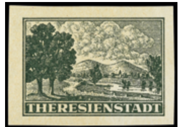
2128 30 €