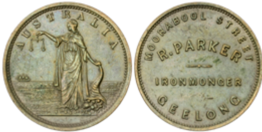
692 120 €