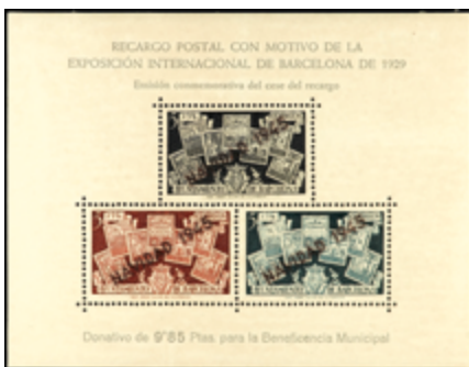
1748 25 €