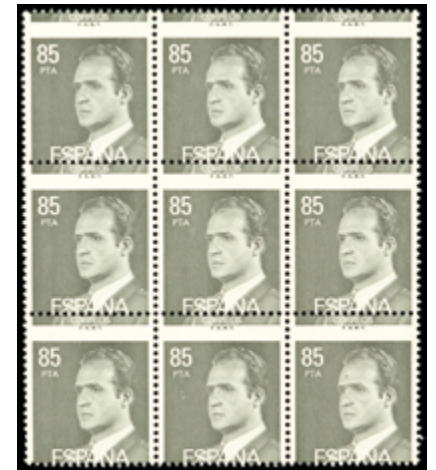
1649 40 €