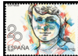
1658 25 €