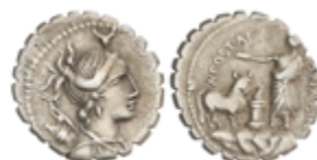
68 100 €