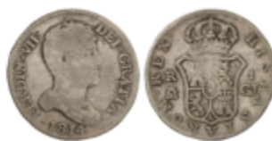
354 65 €