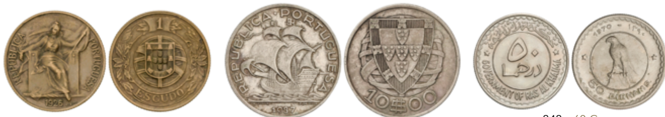
843 125 €