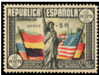
1418 60 €