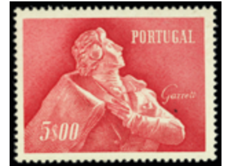
2430 20 €