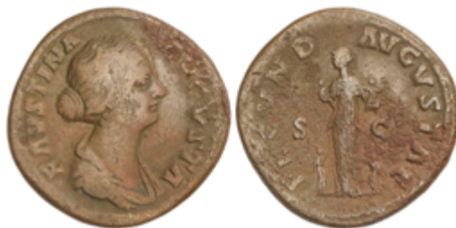
105 30 €