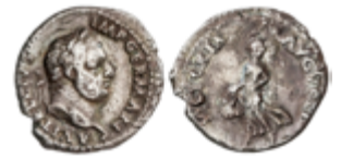
88 100 €