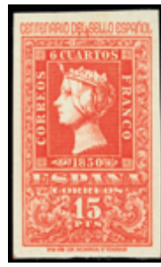
1581 30 €