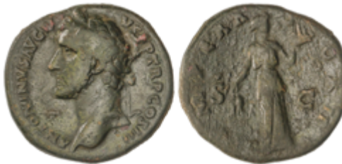
100 60 €