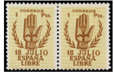
1503 50 €