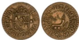
309 80 €