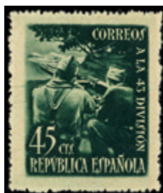
1442 30 €