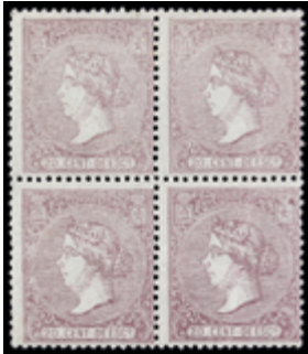
1155 100 €