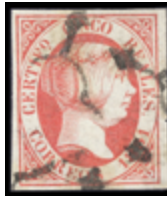
1076 35 €