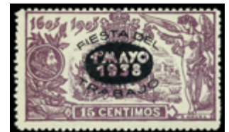
1409 50 €