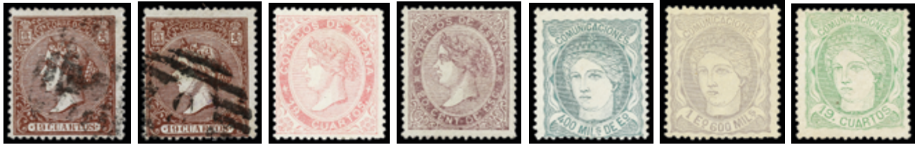
1153 60 € 1154 60 € 1166 100 € 1169 40 € 1195 25 € 1196 200 € 1197 140 €