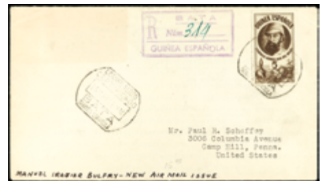
2052 20 €