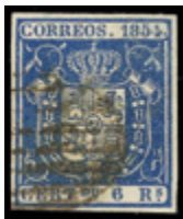
1103 60 €