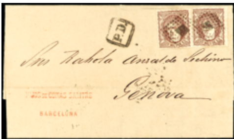
1194 35 €