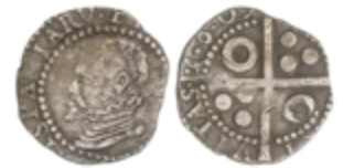
215 50 €