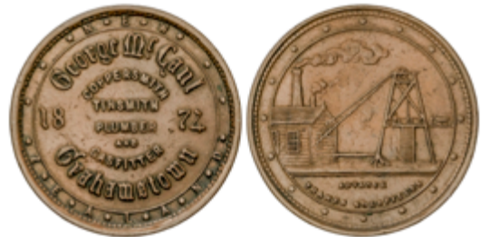
831 65 €