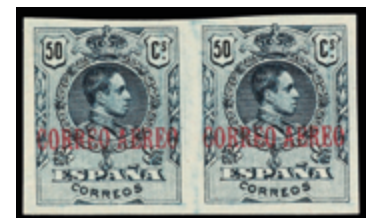
1252 40 €