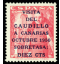
1589 40 €