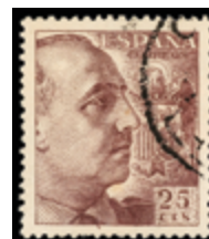
1571 12 €