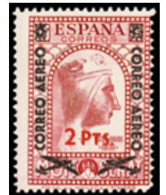
1437 30 €