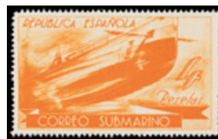
1436 20 €