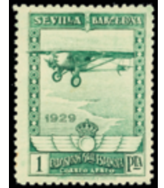
1270 30 €