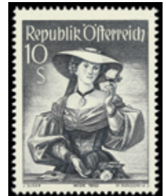
2163 24 €