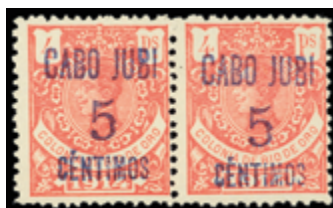
2006 200 €