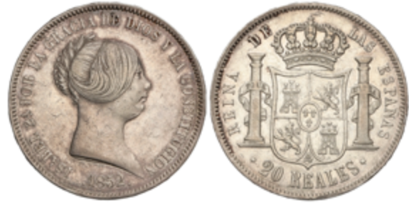
441 60 €