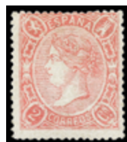
1146 60 €