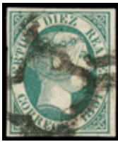
1080 125 €