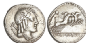
54 70 €