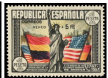
1417 90 €