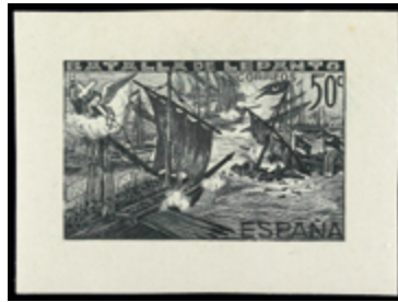
1511 100 €