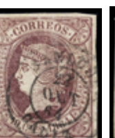
1134 30 €