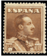
1254 150 €