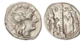
64 85 €