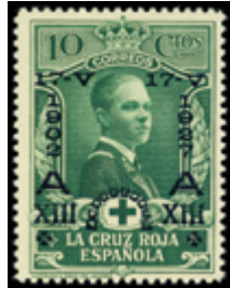
1261 60 €