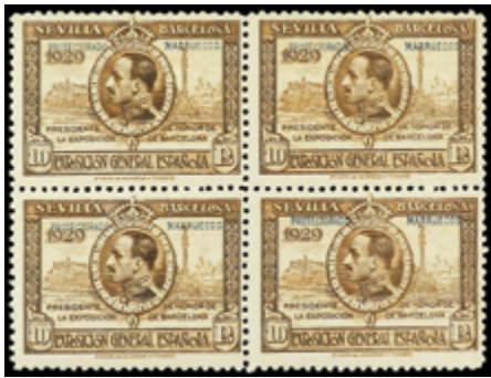
2063 30 €