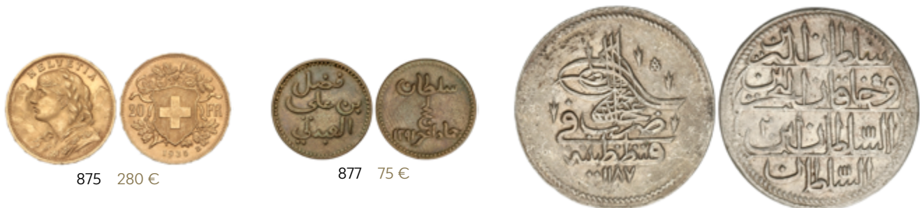
875 280 €