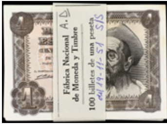
928 150 €