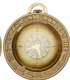
635 50 €