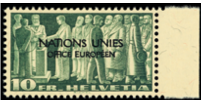
2464 60 €