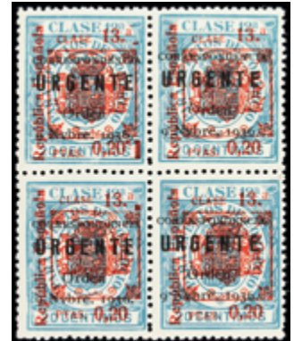
1828 40 €