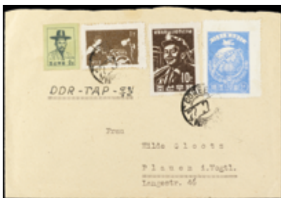
2231 50 €