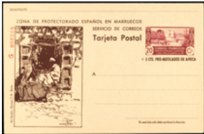
2082 80 €