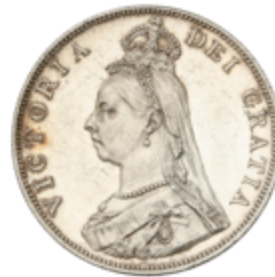
783 50 €