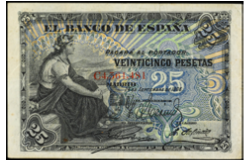
899 50 €