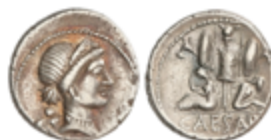
77 150 €