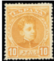
1241 100 €