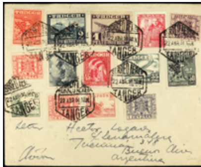
2095 20 €