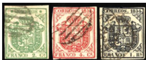
1105 50 €