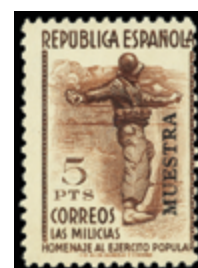
1452 40 €