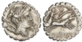
46 70 €