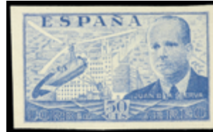
1514 150 €