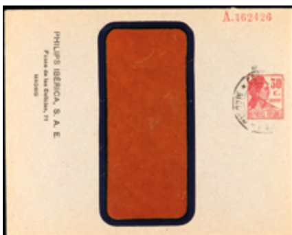
1790 20 €