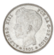
534 60 €