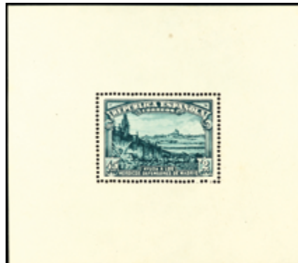
1405 45 €