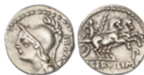
72 90 €