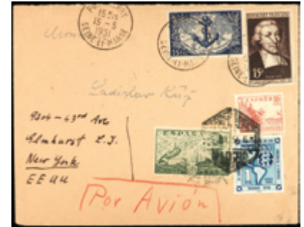
1544 50 €