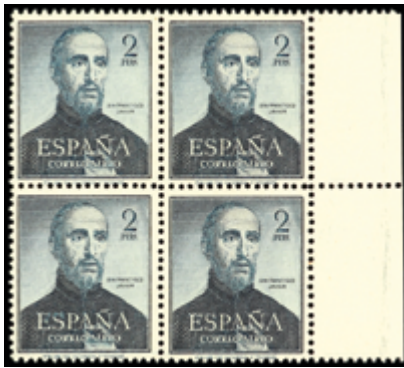
1619 60 €