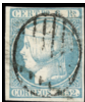
1089 125 €