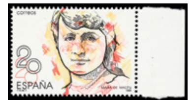
1657 20 €