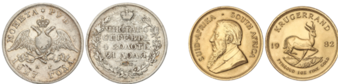
851 60 €