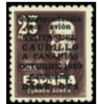
1598 90 €