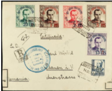
1472 180 €