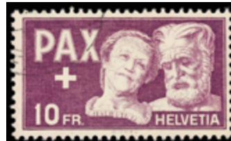
2456 80 €