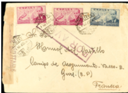
1515 40 €