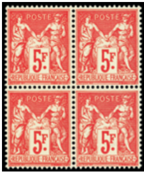
2268 100 €