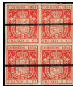
1100 20 €