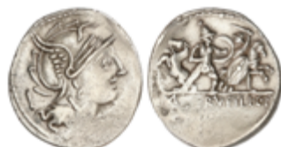
71 75 €