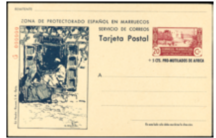
2081 80 €