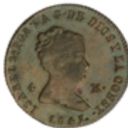
412 50 €