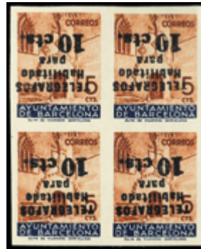
1752 30 €