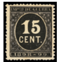
1238 20 €