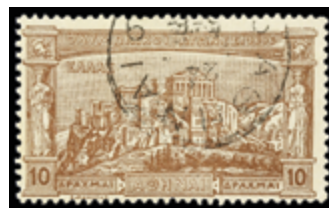
2331 60 €