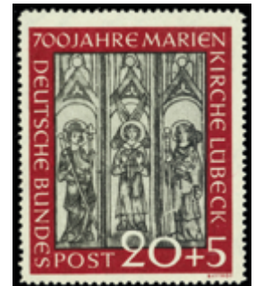
2132 30 €