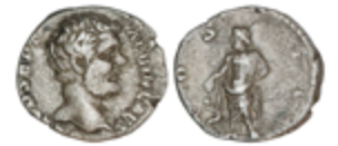
109 60 €