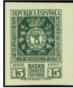
1382 35 €