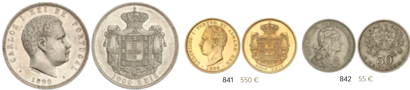
840 50 €