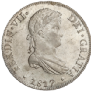
395 400 €