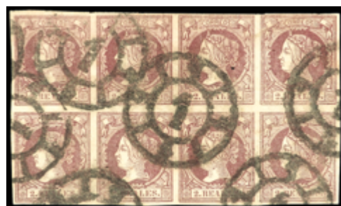
1119 20 €