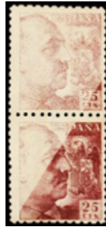
1528 15 €