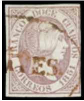
1068 75 €