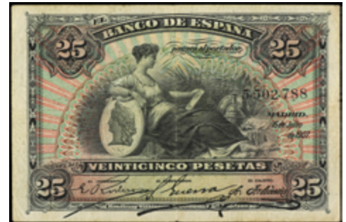
900 60 €