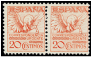
1321 25 €