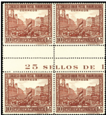
1328 100 €