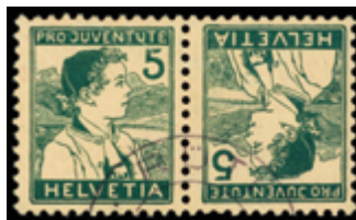
2454 75 €