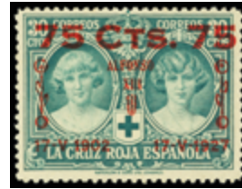
1263 100 €