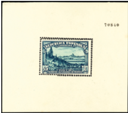
1407 60 €