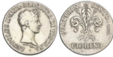
807 90 €