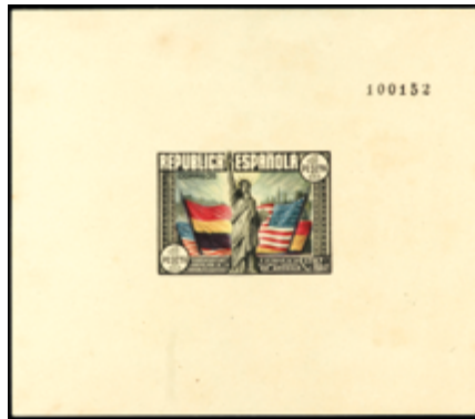
1415 120 €