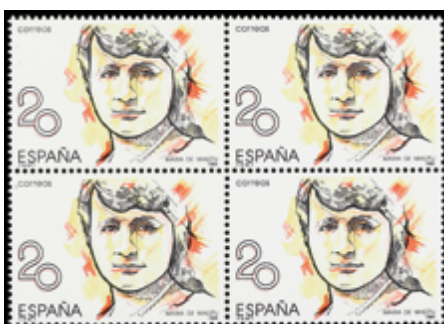
1655 45 €