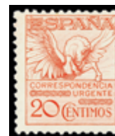
1359 30 €