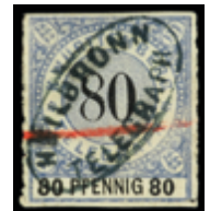
2118 70 €