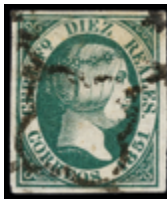
1079 125 €