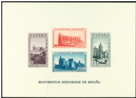
1499 120 €