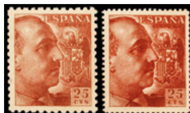
1530 15 €