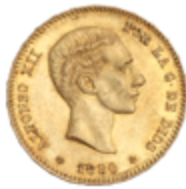
509 350 €