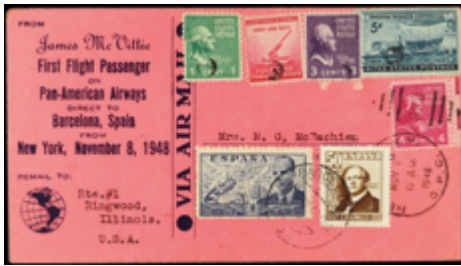
1541 30 €