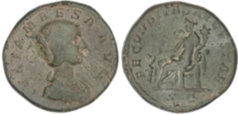
117 110 €