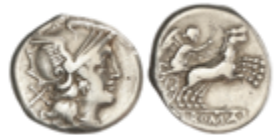
38 70 €