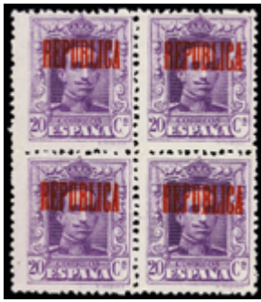
1804 120 €