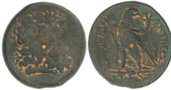
3 50 €