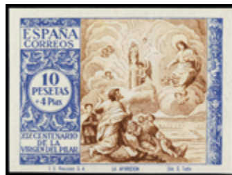
1520 75 €