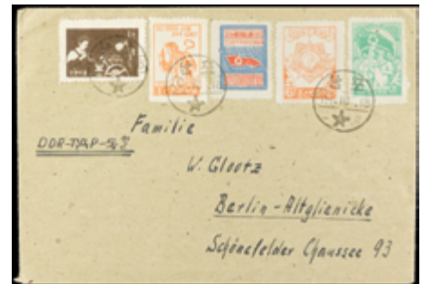
2230 30 €