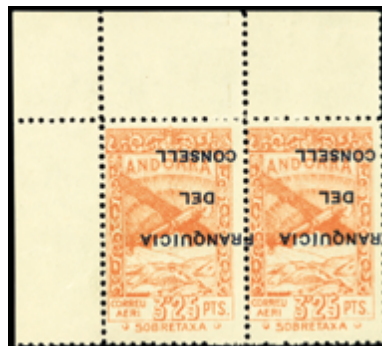
1999 30 €