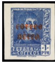
1495 40 €