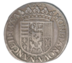
761 60 €