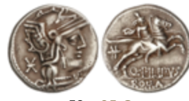
59 85 €