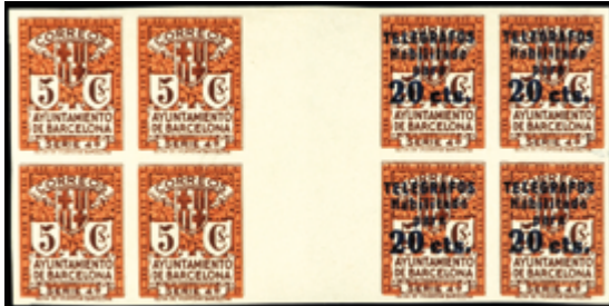
1758 50 €