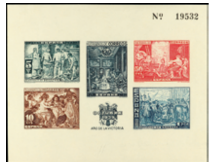
1778 70 €