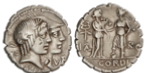
50 135 €