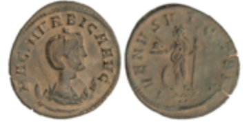
150 80 €