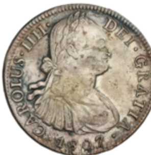
276 50 €