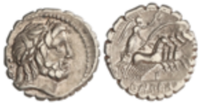
42 50 €