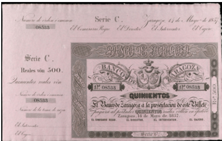
897 180 €