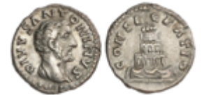
102 70 €