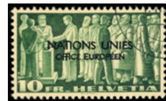
2465 50 €