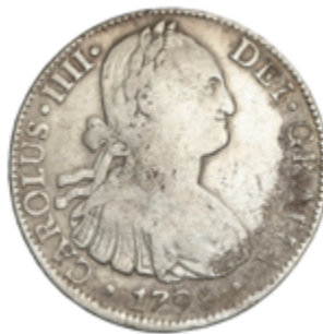
274 30 €