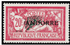
2287 200 €