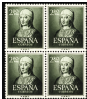
1605 45 €