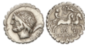
63 110 €