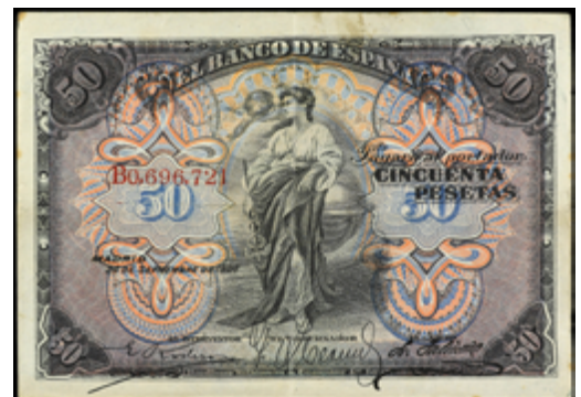
902 50 €