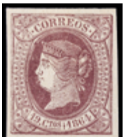
1127 75 €