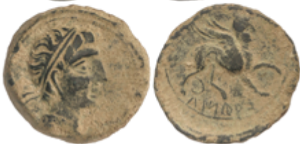
33 65 €