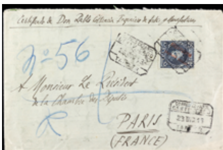
2061 60 €