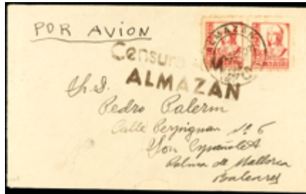
1469 20 €