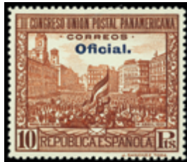
1338 20 €