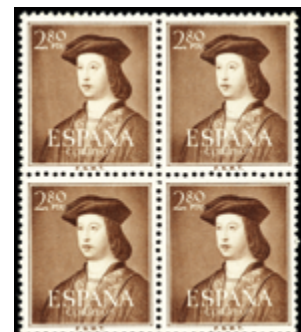
1614 35 €