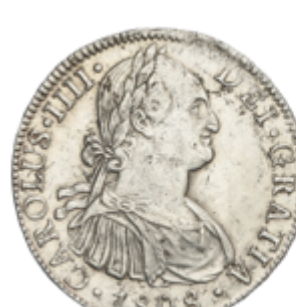
278 75 €