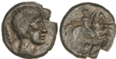
27 50 €