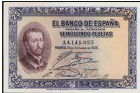
908 60 €