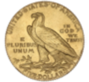
757 350 €