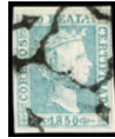
1065 400 €