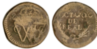
305 35 €