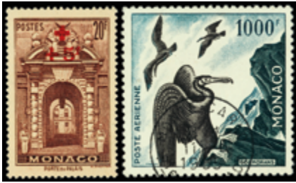
2396 30 €