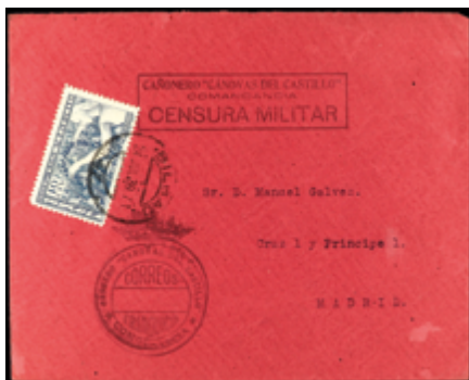
1517 30 €