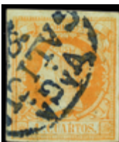
1117 20 €