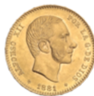
513 375 €