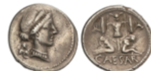
78 100 €