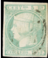
1087 35 €