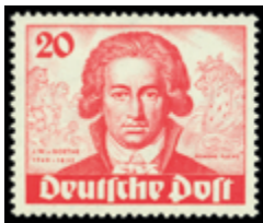
2138 50 €