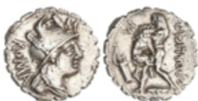
65 100 €