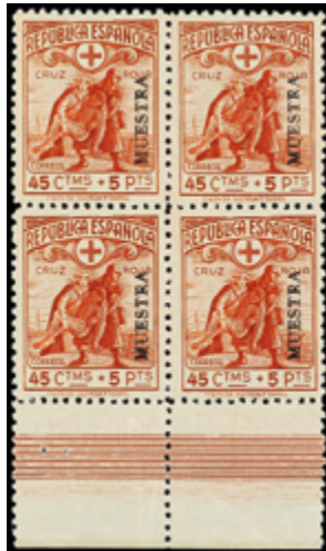
1420 20 €