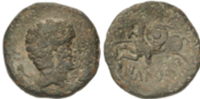
17 50 €