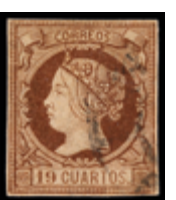
1118 180 €