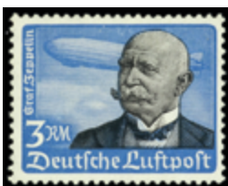
2123 20 €