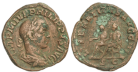
135 50 €