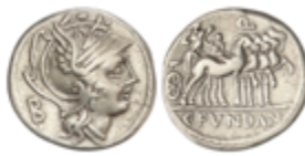
53 60 €