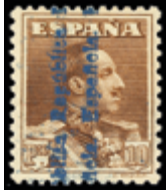
1327 50 €