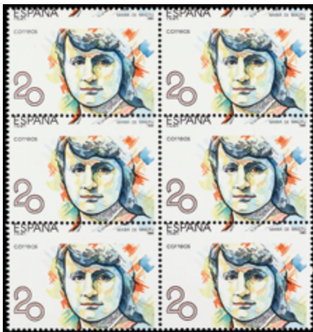
1653 80 €