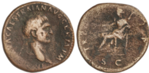
90 60 €