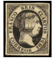
1066 40 €