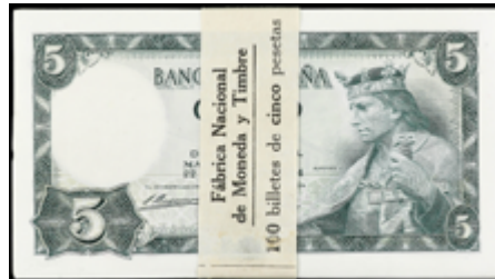
942 150 €