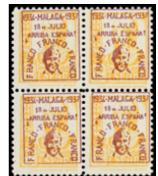
1833 35 €