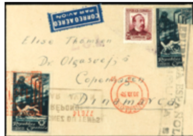
1426 60 €