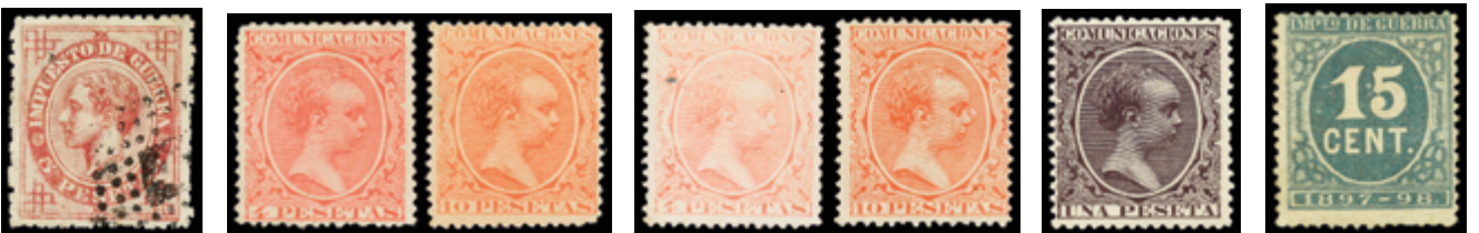
1225 20 € 1228 200 € 1229 160 € 1233 25 € 1236 80 €