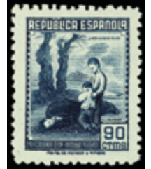
1457 30 €