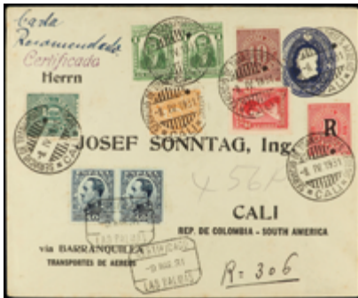
1286 70 €