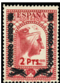
1441 30 €