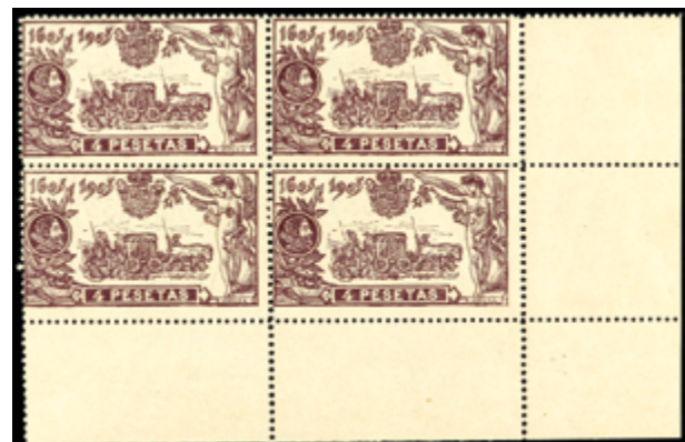
1248 200 €