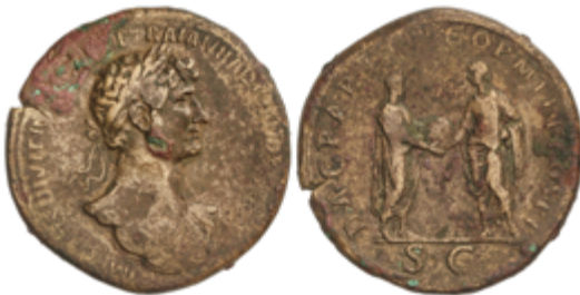
93 50 €