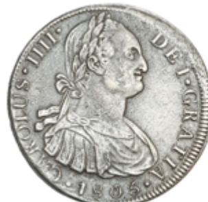
272 50 €