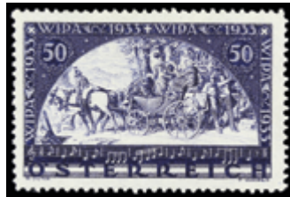
2160 20 €