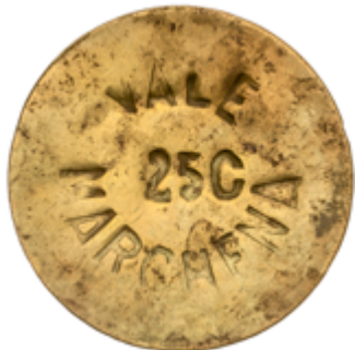
601 70 €