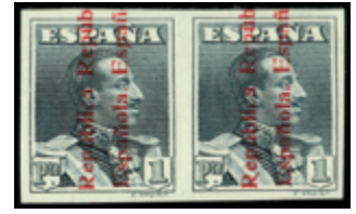
1326 30 €