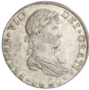
393 50 €