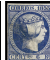
1096 60 €