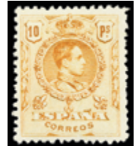
1249 25 €