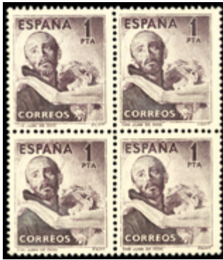
1573 20 €