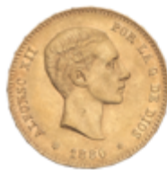
511 375 €