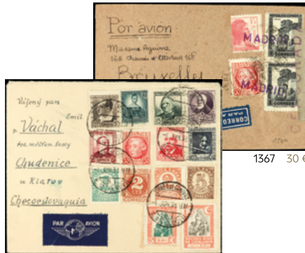
1367 30 €