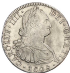
277 75 €