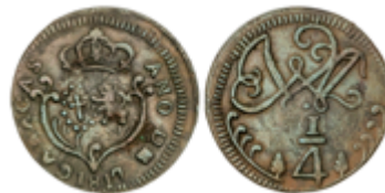
303 80 €