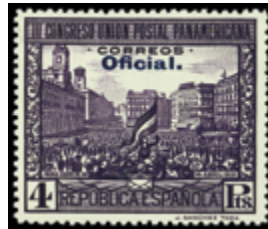
1339 20 €