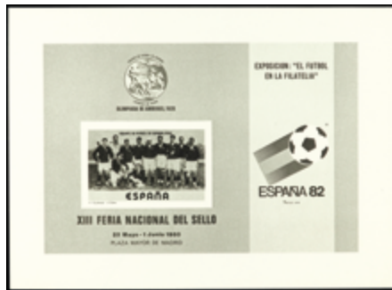
1716 80 €