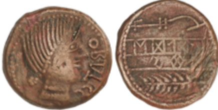
21 40 €