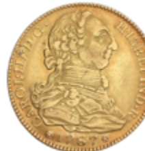
264 600 €