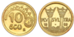
654 145 €