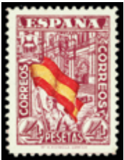
1466 25 €