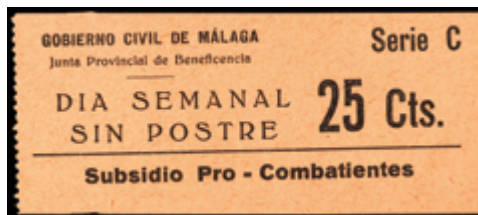
1822 20 €