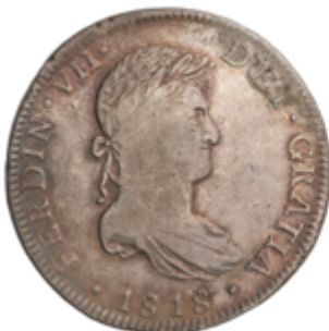
399 50 €