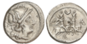
37 60 €