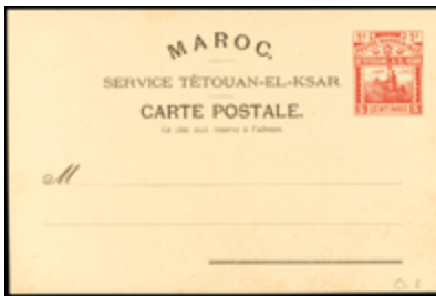
2066 20 €