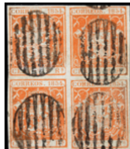
1101 75 €