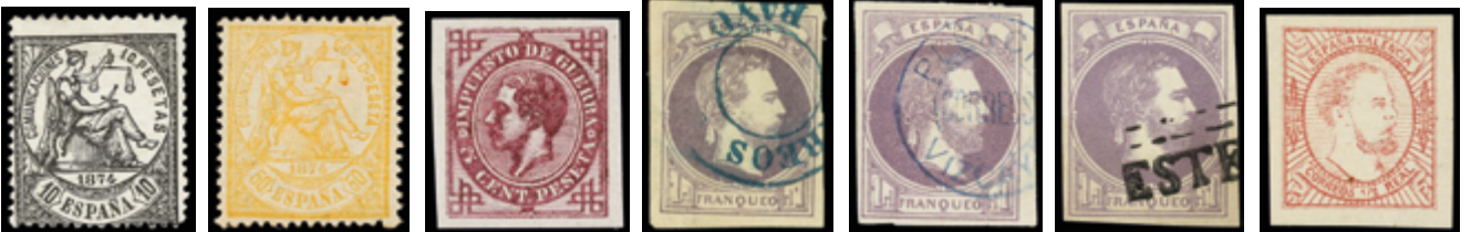
1202 200 € 1206 25 € 1207 Libre 1211 40 € 1212 50 € 1213 90 € 1214 40 €