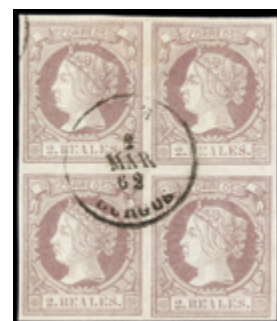
1120 15 €