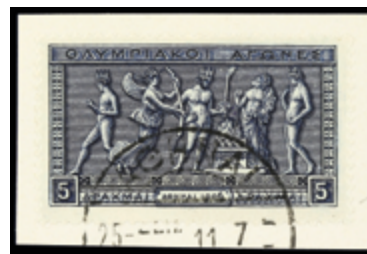
2332 25 €