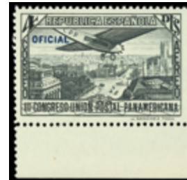
1340 20 €