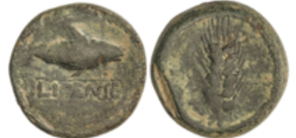
18 40 €