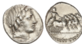
39 100 €