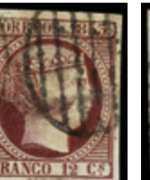
1092 25 €