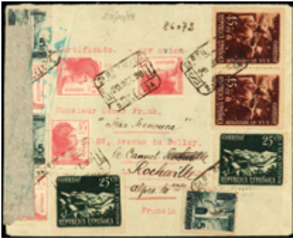
1443 90 €