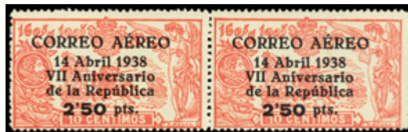
1402 45 €