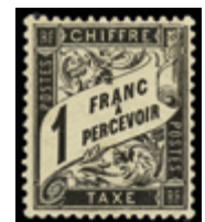
2270 60 €