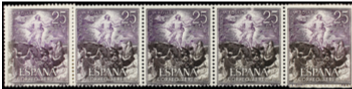
1646 15 €