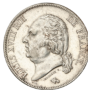
763 50 €