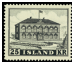
2355 30 €