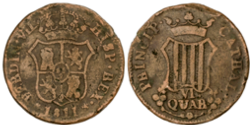
295 55 €