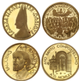
969 300 €