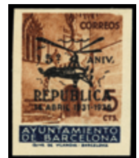
1724 30 €