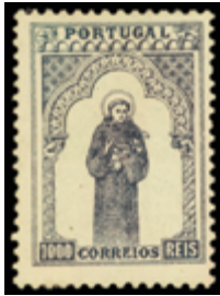
2419 150 €