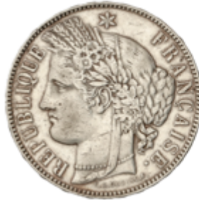
768 50 €