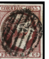
1091 25 €