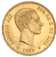
507 350 €