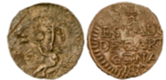
304 80 €