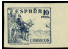
1475 50 €