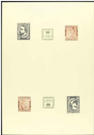
1702 40 €