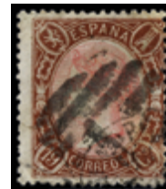
1148 250 €