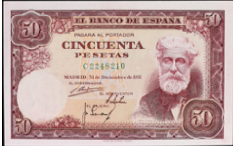
945 110 €