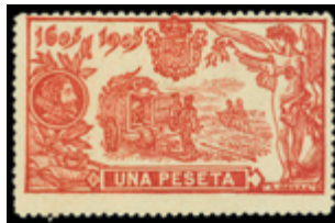
1242 100 €