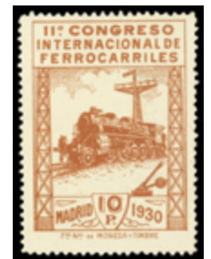
1281 100 €