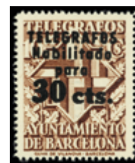
1750 40 €