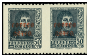
1496 40 €