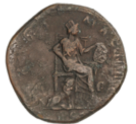
106 60 €