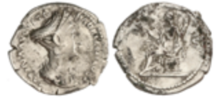
99 50 €