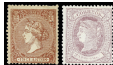
1150 200 €