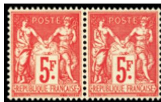
2267 55 €