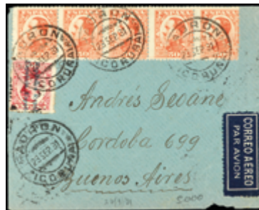
1287 30 €