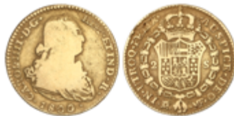
280 290 €