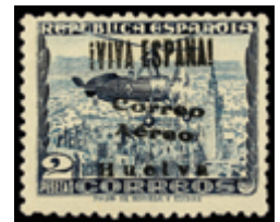
1831 25 €