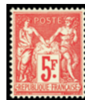
2266 30 €