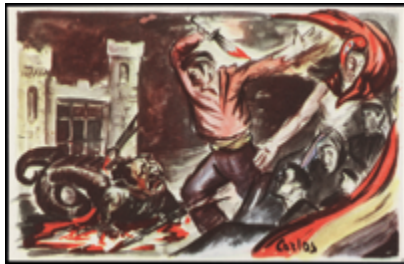
1810 25 €