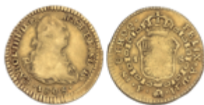
279 160 €