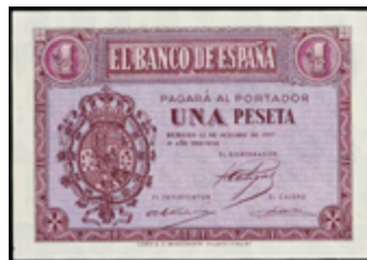
921 125 €