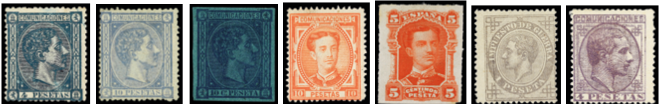
1215 125 € 1216 90 € 1217 Libre 1218 40 € 1223 25 € 1224 25 € 1226 90 €