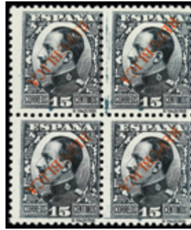
1807 25 €