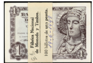
927 150 €