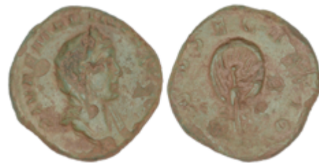
142 125 €