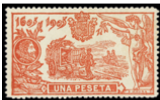
1244 75 €