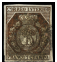
1097 50 €