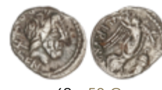
69 50 €