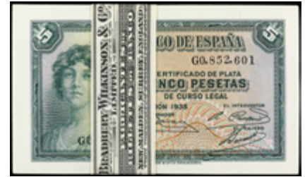
906 150 €