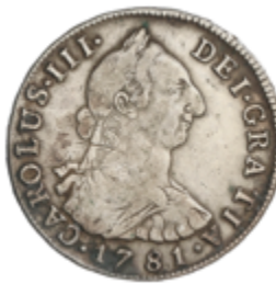
262 90 €