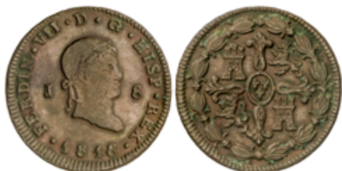
334 55 €