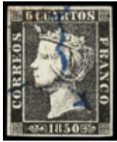
1035 25 €