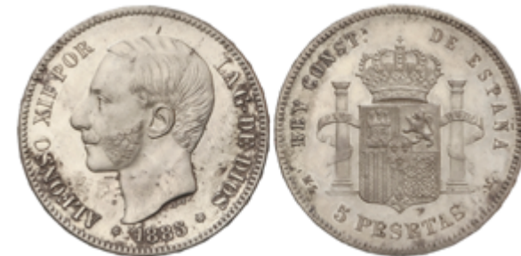
499 60 €