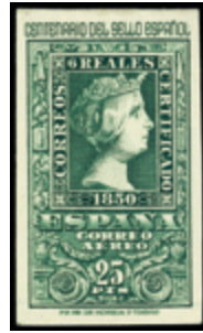
1576 120 €