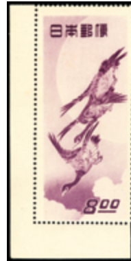
2367 20 €