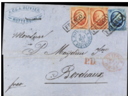
2334 95 €