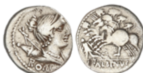
67 80 €