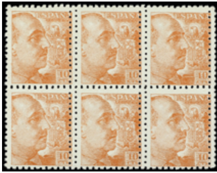
1525 25 €