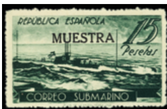
1432 20 €