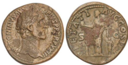
101 50 €