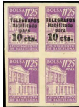
1761 30 €