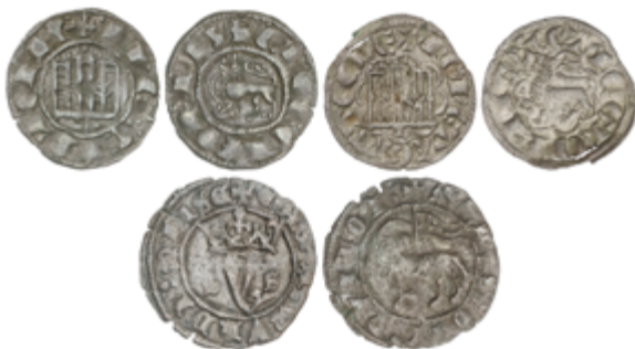
204 40 €