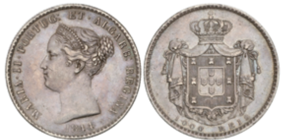
839 200 €