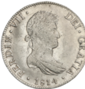
398 60 €