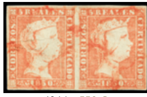
1064 550 €