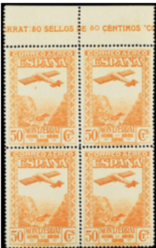
1348 30 €