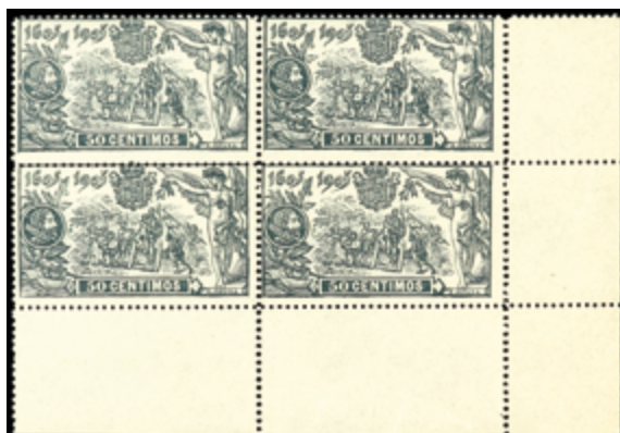
1246 50 €