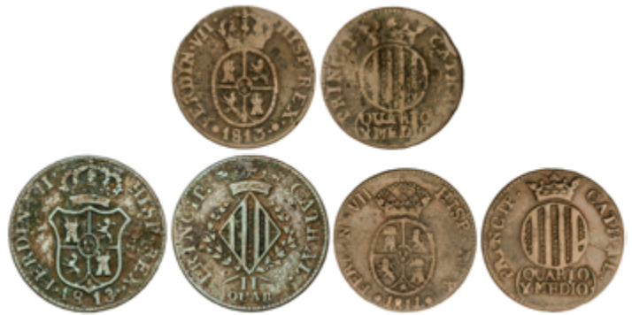
287 60 €