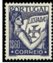
2422 35 €