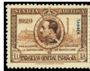
2093 25 €