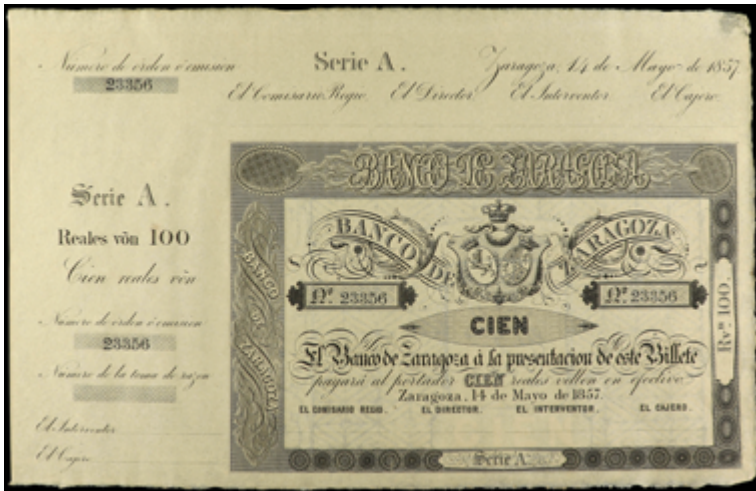
896 160 €