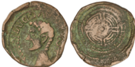
20 50 €