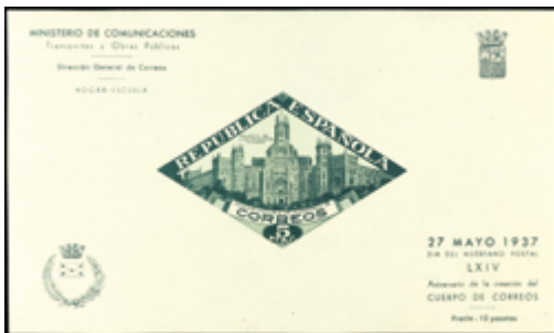
1769 55 €