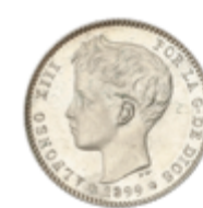
529 50 €