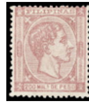
2036 150 €