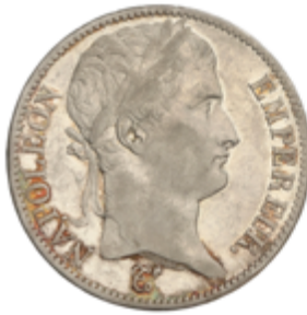
762 60 €