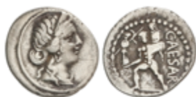
76 90 €