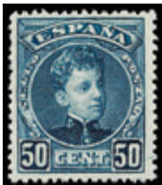
1240 15 €