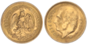
827 200 €