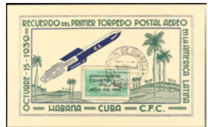
2238 40 €