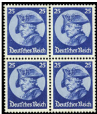
2120 50 €