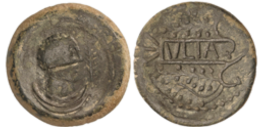
32 50 €