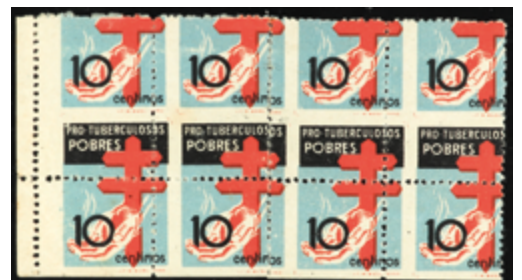
1484 35 €