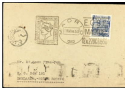
1554 15 €