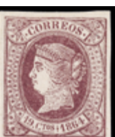
1133 50 €