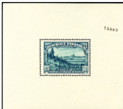
1404 60 €