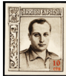
1771 30 €