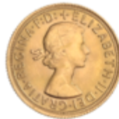
788 375 €