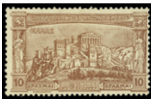
2330 140 €