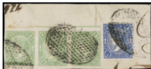
1145 100 €