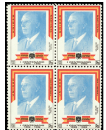
1667 50 €