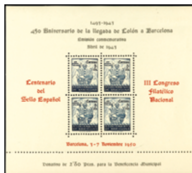
1749 40 €