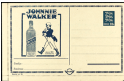
2258 50 €