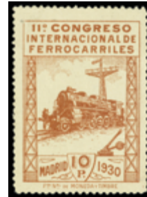
1280 100 €