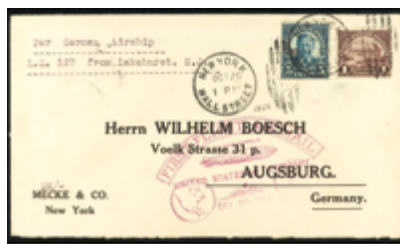
2249 20 €