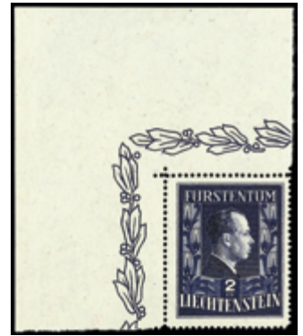
2379 110 €