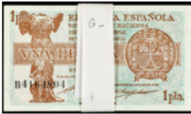
904 150 €