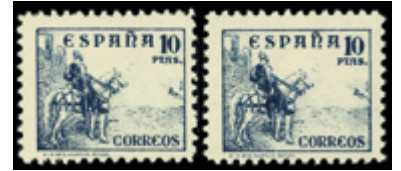
1474 50 €