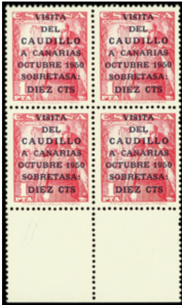
1585 400 €