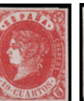
1122 75 €