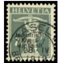
2459 80 €