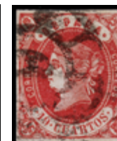
1124 70 €