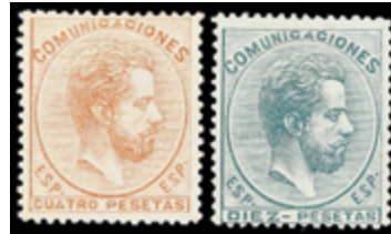
1199 450 €