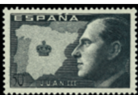
1574 50 €