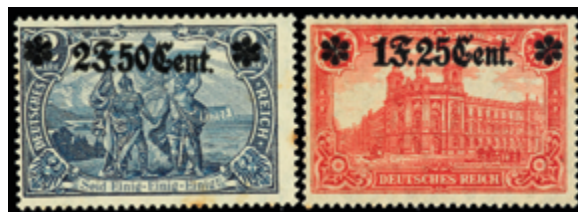
2127 20 €