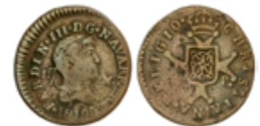
315 65 €