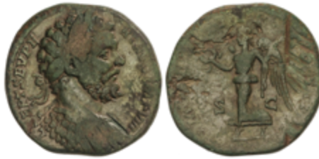
110 120 €