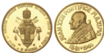
979 300 €