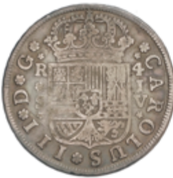
263 55 €