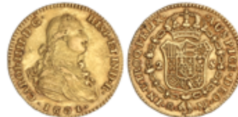
281 300 €