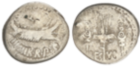
80 50 €