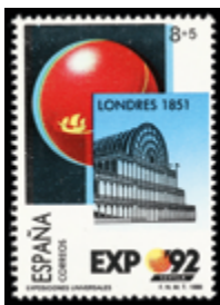
1662 15 €