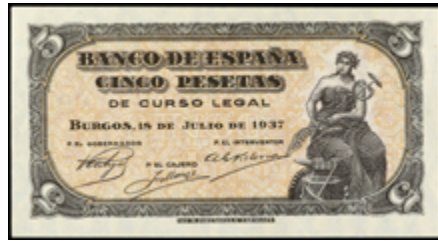
931 150 €