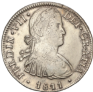
397 50 €