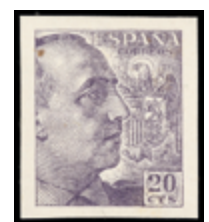
1570 30 €