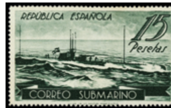
1427 90 €