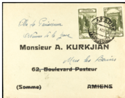
2062 20 €