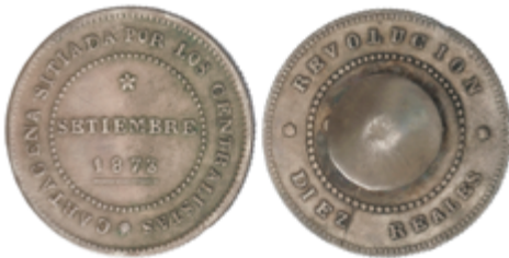
462 100 €