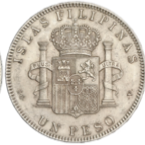
574 90 €