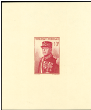
2399 30 €