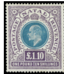
2325 50 €