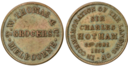
689 210 €