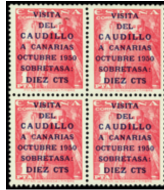
1595 140 €