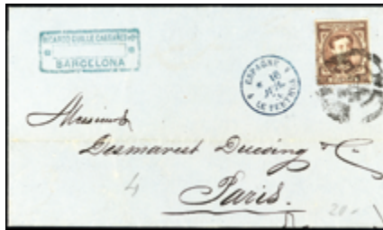
1222 20 €