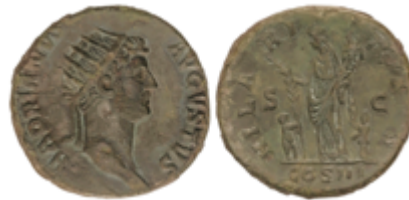
92 100 €