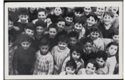
1809 40 €