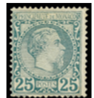
2395 95 €