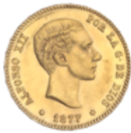
505 375 €