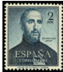
1620 25 €