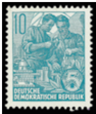
2144 24 €