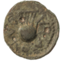
7 80 €