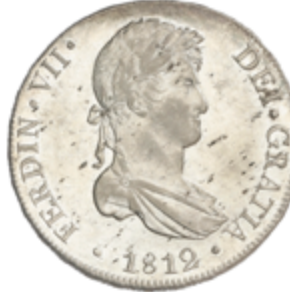
394 300 €