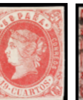
1123 75 €