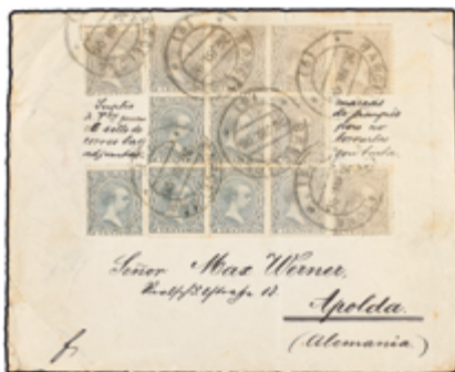
1231 35 €