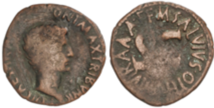
83 25 €