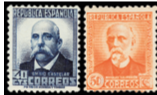
1350 30 €