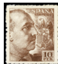
1538 40 €