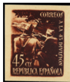
1444 15 €