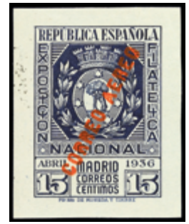
1384 50 €