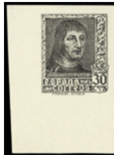
1488 400 €