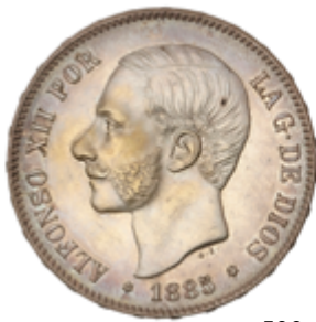
500 75 €