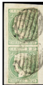
1088 60 €