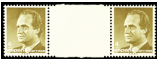
1650 25 €