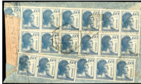
1396 75 €