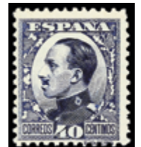
1284 50 €