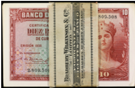
907 100 €