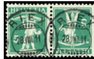
2453 50 €