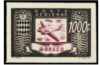
2398 20 €