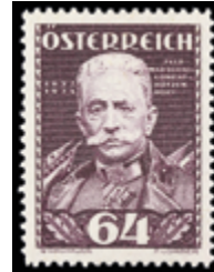
2162 10 €