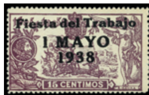
1411 50 €