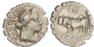
62 80 €