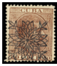
2018 275 €