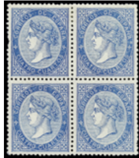
1161 30 €