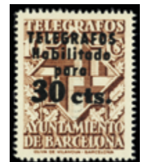
1762 35 €