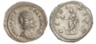
114 50 €