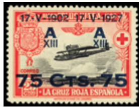
1264 55 €