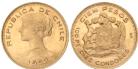
707 925 €