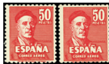
1565 90 €