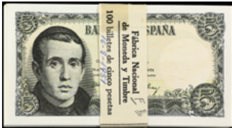
941 100 €