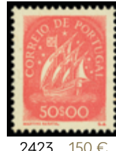
2423 150 €