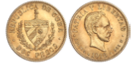
716 200 €