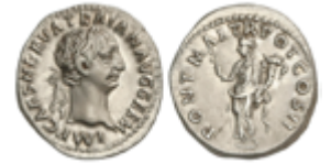
91 150 €