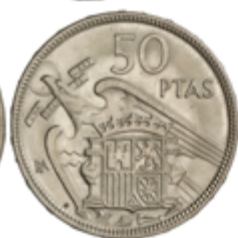
625 110 €