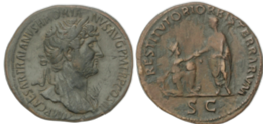
96 225 €