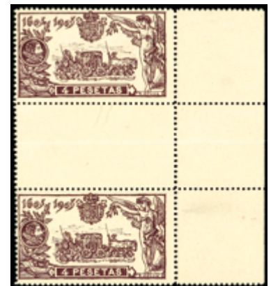
1247 100 €