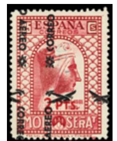
1439 35 €