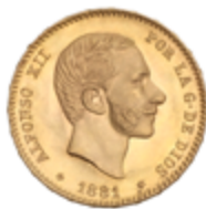
512 350 €