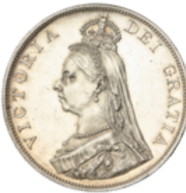
782 50 €