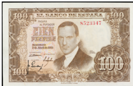
946 90 €