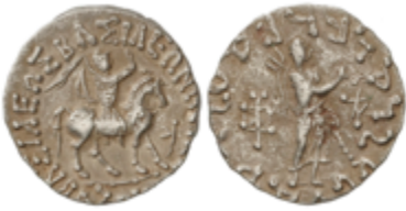
4 70 €