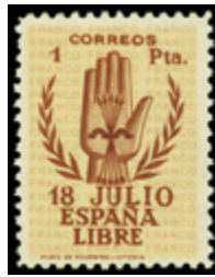
1501 30 €