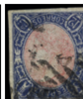
1141 75 €