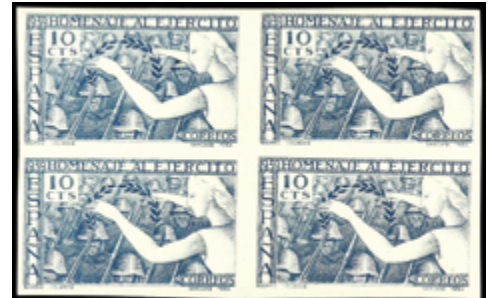
1516 50 €