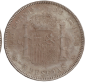
569 50 €