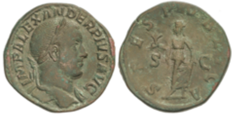
120 50 €