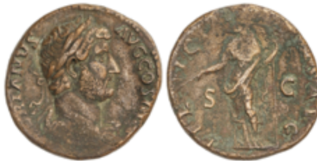
94 90 €