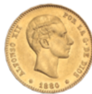
510 375 €