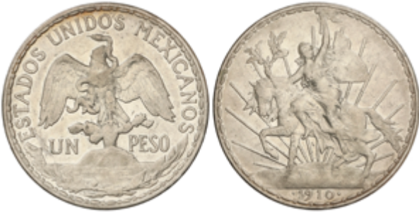
815 50 €