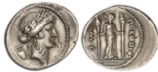
47 100 €