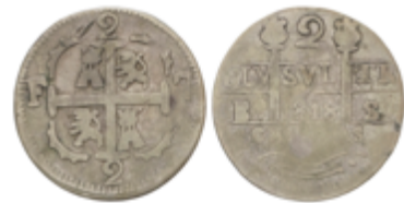
363 90 €