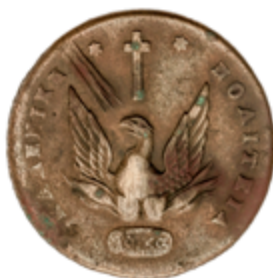
790 90 €