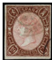
1143 150 €