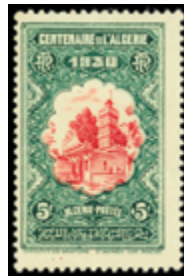
2291 20 €