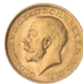
785 375 €