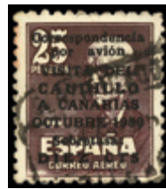
1600 50 €