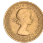
789 375 €