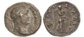
97 90 €