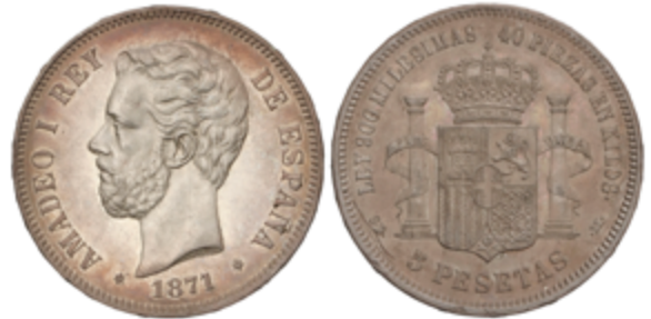
463 100 €