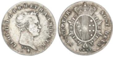
806 55 €