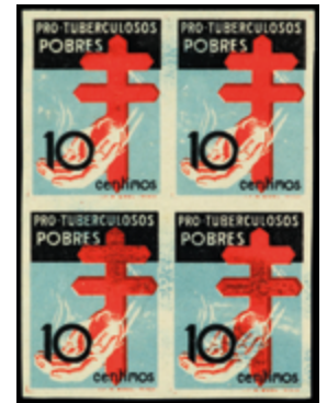
1482 35 €