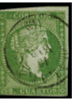
1107 120 €