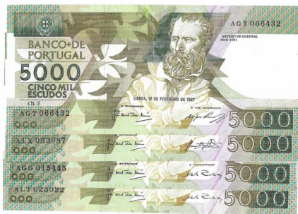
330 Lote de 5 Notas de 5.000 Escudos Ch.2, 12 de Fevereiro de 1987, ATL 023022, AGG 015445, ALX 033087, AGT 066432, Pick# 183a, bela / quase nova 120 €