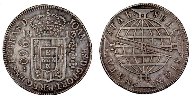
209 D. João Príncipe Regente 960 Réis (Patacão) 1813 Rio de Janeiro, recunhada sobre 8 Reales Lima JP, prata, AG.29.10, MBC 110 €