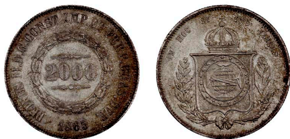
250 D. Pedro II 2.000 Réis 1865, prata, KM#462, bela