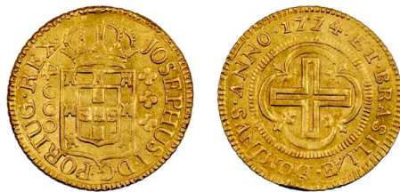
203 D. José I 4.000 Réis 1774, ouro, 1º Tipo "Reverso invertido", CA.0297, MBC+