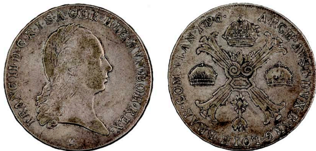
245 Franc II Kronenthaler 1796 C, prata, KM#62.1, MBC