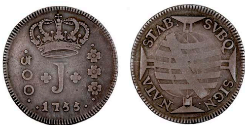
200 D. José I 300 Réis 1755 Rio de Janeiro, prata, AG.41.03, MBC