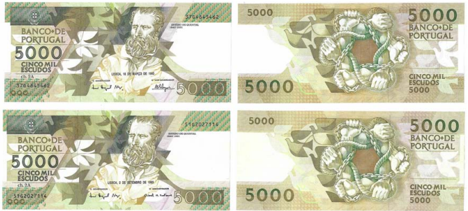
333 Lote de 2 Notas de 5.000 Escudos Ch.2A, 18 de Março de 1993, 37G4645462, 51G2027114, Pick# 184e, novas 60 €