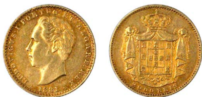
164 D. Luís I 2.000 Réis (Quinto de Coroa) 1881, ouro, AG.14.13, MBC