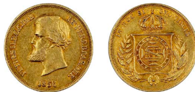
252 D. Pedro II 10.000 Réis 1856, ouro, Neves O646, MBC+