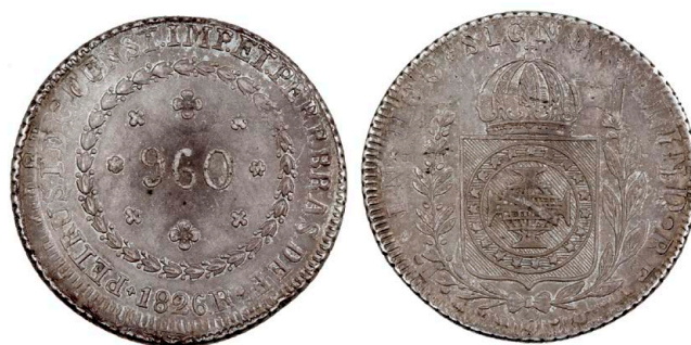
231 D. Pedro I 960 Réis 1826 Rio de Janeiro, recunhada sobre 8 Reales México, prata, Amato-Neves P507, MBC 250 €