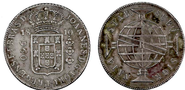
205 D. João Príncipe Regente 960 Réis (Patacão) 1810 Rio de Janeiro, sem arcos internos, prata, AG.20.02v, MBC+