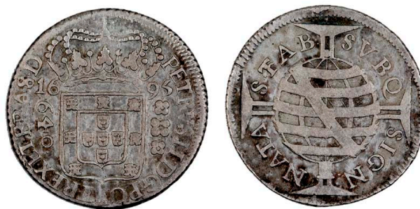
195 D. Pedro II 640 Réis (Duas Patacas) 1695, coroa grande, ET.BRAS.D, prata, AG.22.01, MBC