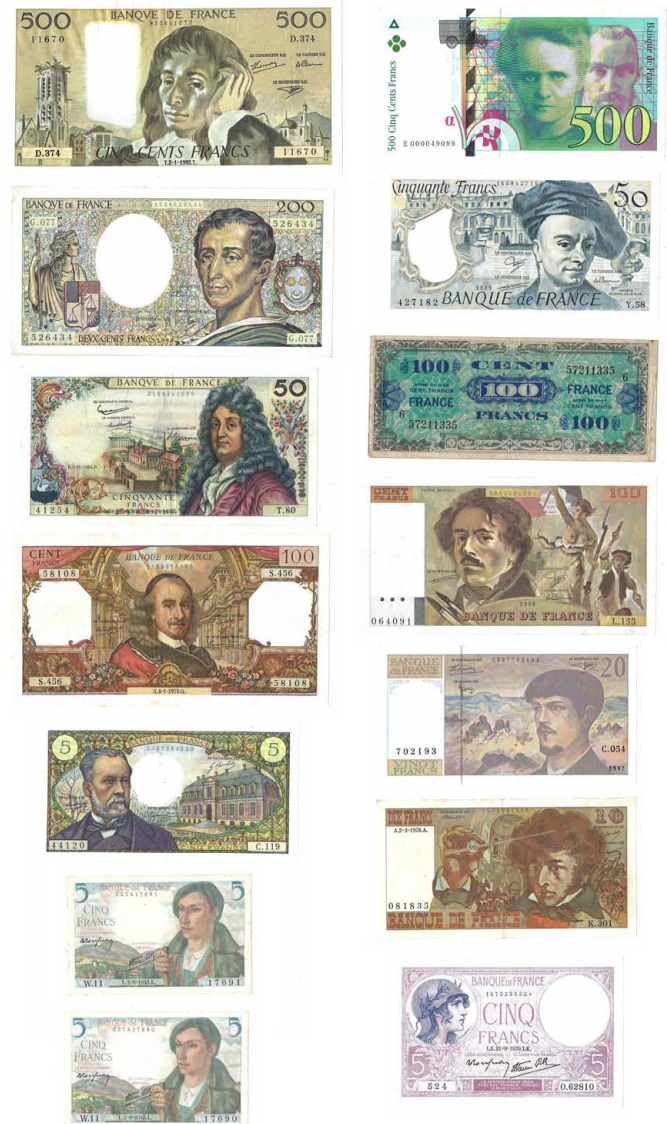
361 Lote de 14 Notas Banco de França. 2 x 5 Francos 1943 (P# 98a); 1 x 5 Francos 1939 (P# 83); 1 x 5 Francos 1970 (Pick# 146b); 1 x 10 Francos 1978 (P# 150c); 1 x 20 Francos 1997 (P# 151i); 1 x 50 Francos 1989 (P# 152d); 1 x 50 Francos 1964 (P# 148a); 1 x 100 Francos 1944 (P# 118a); 1 x 100 Francos 1970 (P# 149c); 1 x 100 Francos 1989 (P# 154d); 1 x 200 Francos 1990 (P# 155d); 1 x 500 Francs 1992 (P# 156b); 1 x 500 Francos 1994 (P# 160a); MBC+ / bela / quase nova 200 €