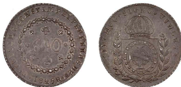
249 D. Pedro I 640 Réis 1825 Rio de Janeiro, Amato-Neves P501, bela