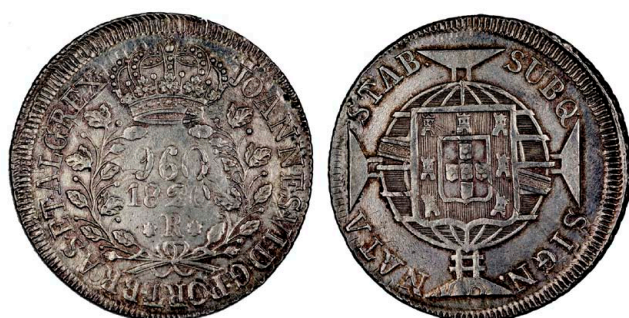
227 D. João VI 960 Réis (Patacão) 1820 Rio de Janeiro, Chile independente, cunhagem descentrada, prata, AG.25.10, MBC 160 €