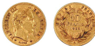
261 Napoleão III 10 Francos 1865, ouro, KM# 800.1, MBC