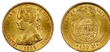
259 Isabel II 100 Reales 1862, estrelas de 7 pontas, ouro, KM# 605.3, soberba