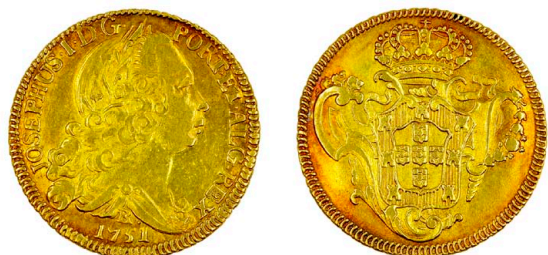
117 D. José I Peça (6.400 Réis) 1751 Bahia, JOSEPHUS, B sobre R, ouro, AG.54.01, bela 2250 €