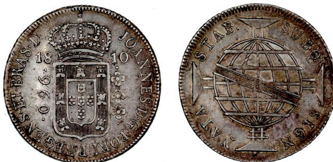
204 D. João Príncipe Regente 960 Réis (Patacão) 1810 Rio de Janeiro, data emendada 10/09, prata, AG.29.04, MBC