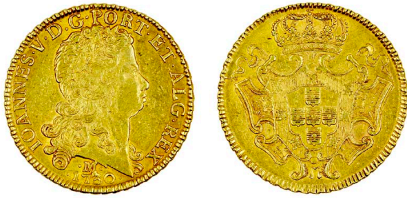
107 D. João V Dobra (12.800 Réis) 1730 Minas Gerais, ouro, RS.575, AG.140.07, bela 4300 €