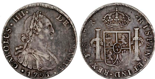
247 Carlos IV 8 Reales 1791 PR Potosi, prata, Calico 991, MBC