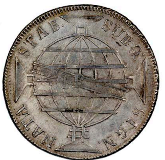
219 D. João Príncipe Regente 960 Réis (Patacão) 1818 Rio de Janeiro, data emendada 8/7, Chile Independente, prata, AG.29.22, MBC 130 €