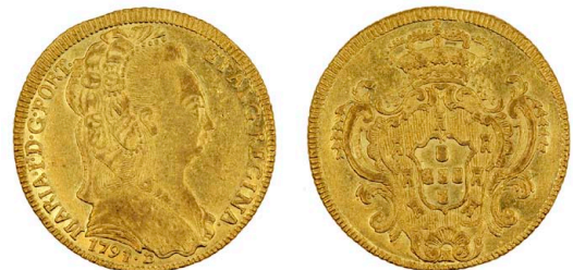
126 D. Maria I Peça (6.400 Réis) 1791 Bahia B junto a data, ouro, RS.94, AG.31.02, bela 1800 €