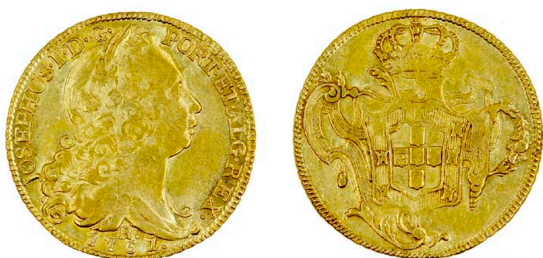
121 D. José I Peça (6.400 Réis) 1767 Rio de Janeiro, JOSEPHUS, AG.55.19, ouro, MBC+ 800 €