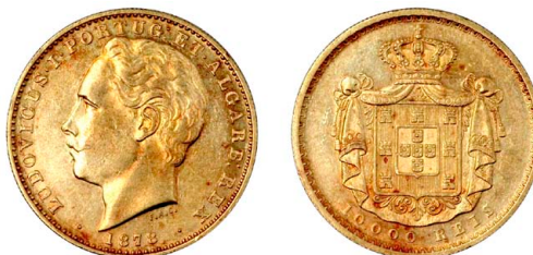
181 D. Luís I 10.000 Réis (Coroa) 1878, ouro, AG.11.01, bela