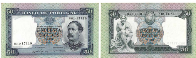
301 Nota de 50 Escudos Ch.7A, 24 de Junho de 1960, BHD 17119, Pick# 164, quase bela 10 €