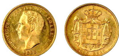
176 D. Luís I 5.000 Réis (Meia Coroa) 1883, ouro, AG.16.13, soberba