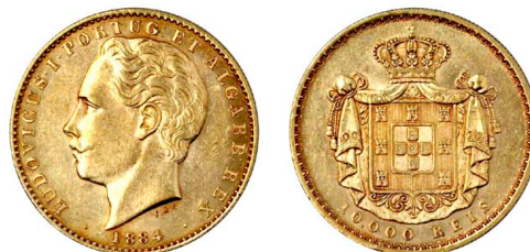
183 D. Luís I 10.000 Réis 1884, ouro, AG.17.10, bela