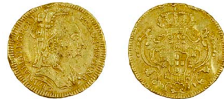
125 D. Maria I Meio Escudo (800 Réis) 1789, toucado, ouro, AG.22.01, BC 120 €