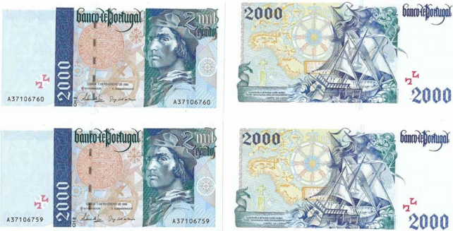
328 Lote de 2 Notas de 2.000 Escudos Ch.2, 1 de Fevereiro de 1996, numeração seguida A37106759/60, Pick# 189b, quase novas 20 €