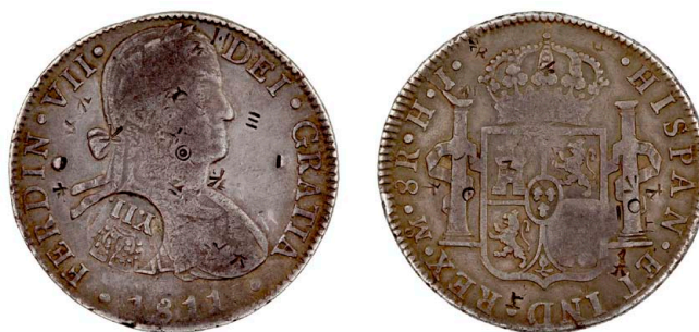
260 Fernando VII 8 Reales 1811 HJ, busto imaginário, carimbo Filipinas, carimbos chineses, prata, Calico 1317, MBC