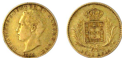
163 D. Luís I 2.000 Réis (Quinto de Coroa) 1865, ouro, AG.13.02, MBC-