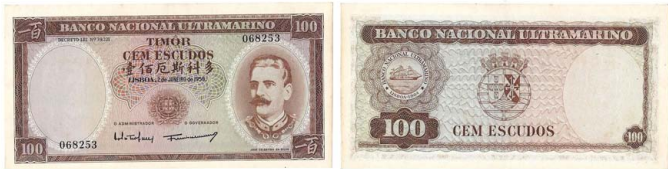
357 Nota de 100 Escudos Banco Nacional Ultramarino, 2 de Janeiro de 1959, 068253, Pick# 24, ligeiras machas no bordo, quase nova 20 €