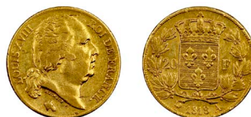
263 Louis XVIII 20 Francos 1818 A, ouro, KM# 712.1, MBC-