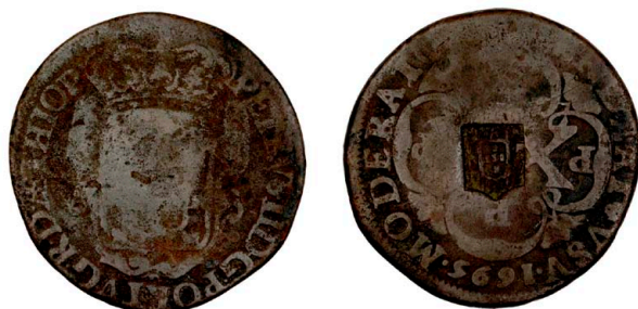
194 Carimbo de Escudete de D. João Príncipe Regente sobre XX Réis de D. Pedro II 1696, cobre, AG.66.04, BC+