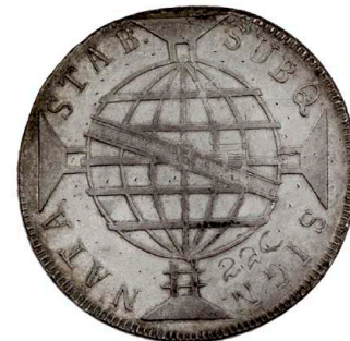
221 D. João Príncipe Regente 960 Réis (Patacão) 1818 Rio de Janeiro, prata, AG.29.21, MBC 90 €