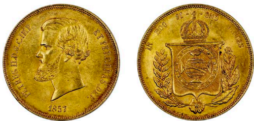
254 D. Pedro II 20.000 Réis 1857, ouro, Neves O677, bela