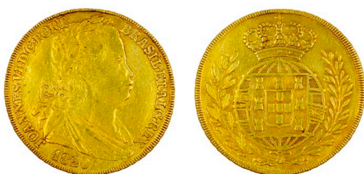
143 D. João VI Peça (6.400 Réis) 1820, ouro, RARA, AG.18.03, MBC