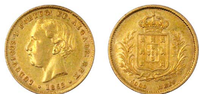
165 D. Luís I 5.000 Réis (Meia Coroa) 1862, ouro, AG.15.01, MBC+