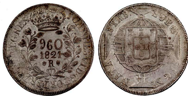
228 D. João VI 960 Réis (Patacão) 1821 Rio de Janeiro, recunhada sobre 8 Reales Potosi PJ, prata, AG.25.20, MBC 120 €