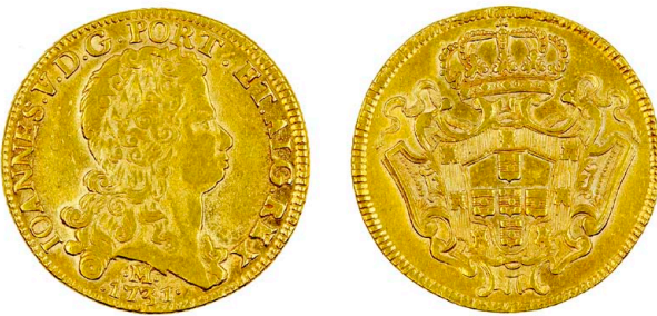
110 D. João V Dobra (12.800 Réis) 1731 Minas Gerais, serrilha de corda, ouro, RS.575, AG.140.07, bela 4800 €