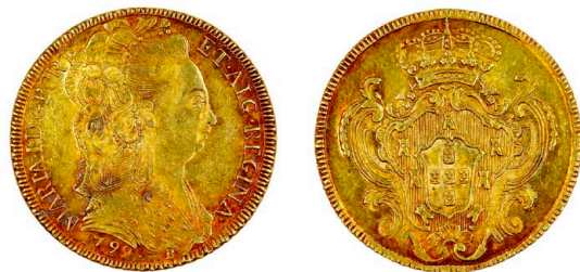
127 D. Maria I Peça (6.400 Réis) 1799 Bahia, B afastado da data, ouro, RS.94, AG.31.02, bela 1500 €