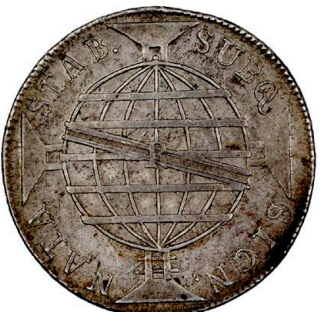
218 D. João Príncipe Regente 960 Réis (Patacão) 1817 Rio de Janeiro, recunhada sobre 8 Reales México FM, prata, AG.29.20, MBC+ 120 €