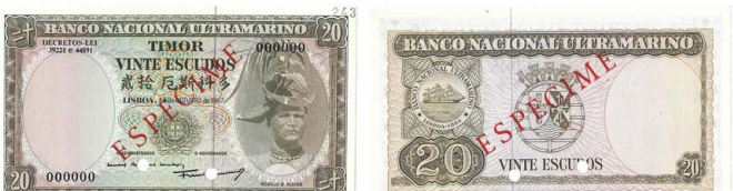
359 Nota de 20 Escudos Banco Nacional Ultramarino, 24 de Outubro de 1967, ESPÉCIME, 000000, Pick# 26s, nova 50 €