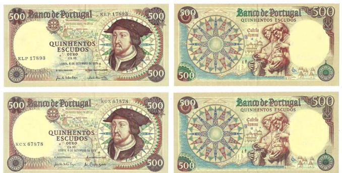
317 Lote de 2 Notas de 500 Escudos Ch.10, 6 de Setembro de 1979, KLP 17893, KCX 67878, Pick#170b, MBC+ / quase nova 20 €