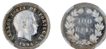
186 D. Carlos I 100 Réis 1894 "Proof-Like", prata, AG.06.08, NGC 6637860-001, MS 64 PL