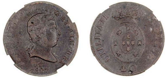
144 D. Pedro IV Pataco (40 Réis) 1827, data sem pontos, ET.ALG.REX, AG.02.04, bronze, GENI PTXRDAOYN, MS 62