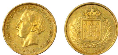
166 D. Luís I 5.000 Réis (Meia Coroa) 1862, ouro, AG.15.01, MBC+