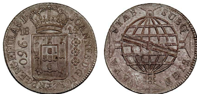
211 D. João Príncipe Regente 960 Réis (Patacão) 1814 Rio de Janeiro, recunhada sobre 8 Reales Potosi PJ, prata, AG.29.14, MBC 110 €