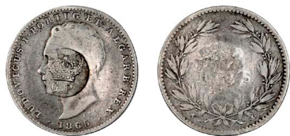
189 Carimbo GP Coroado de D. Luís I sobre 200 Réis de 1865 (240 Réis), prata, AG.12.02, BC+