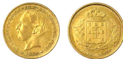
167 D. Luís I 5.000 Réis (Meia Coroa) 1863, ouro, AG.15.02, MBC