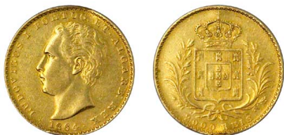
162 D. Luís I 2.000 Réis (Quinto de Coroa) 1864, ouro, AG.13.01, mossa na serrilha às 7h, vestígios de solda na parte superior da serrilha, BC