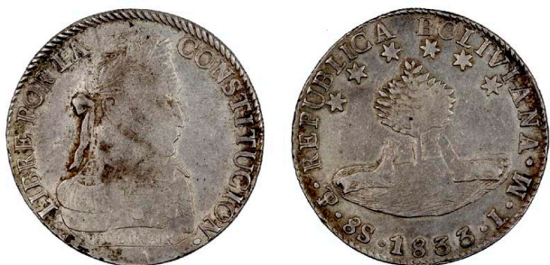
248 8 Soles 1833 LM, prata, KM#97, MBC