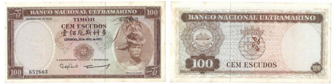
360 Nota de 100 Escudos Banco Nacional Ultramarino, 25 de Abril de 1963, 652663, assinatura Gaivão e Machado, Pick# 28f, bela 10 €