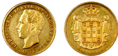
175 D. Luís I 5.000 Réis (Meia Coroa) 1876, ouro, AG.16.09, bela