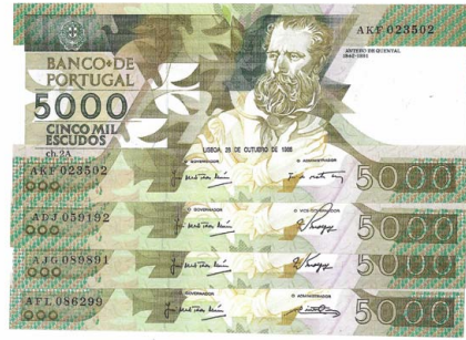
331 Lote de 4 Notas de 5.000 Escudos Ch.2A, 28 de Outubro de 1988, AFL 086299, AJG 089891, ADJ 059192, AKF 023502, Pick# 184a, bela / quase nova 120 €