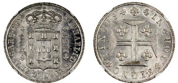
146 D. Miguel I Cruzado (480 Réis) 1833, prata, AG.12.06, NGC 667333-001, "TOP GRADE", MS 64