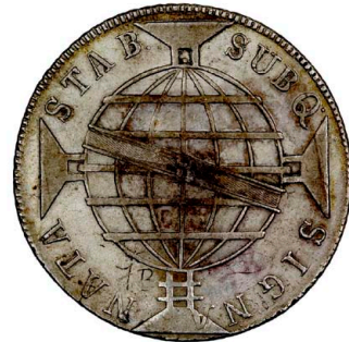
220 D. João Príncipe Regente 960 Réis (Patacão) 1818 Rio de Janeiro, Chile independente, prata, AG.29.21, MBC 170 €