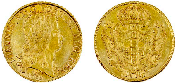
114 D. João V Dobra (12.800 Réis) 1733 Minas Gerais, ouro, AG.140.11, bela 2750 €