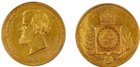
255 D. Pedro II 20.000 Réis 1862, ouro, "Eixo desviado", CA.0682, MBC+