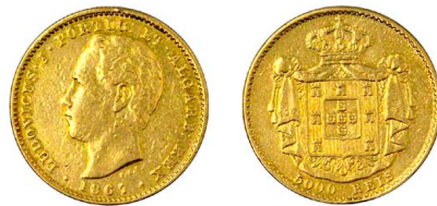
168 D. Luís I 5.000 Réis (Meia Coroa) 1867, ouro, AG.16.01, MBC-