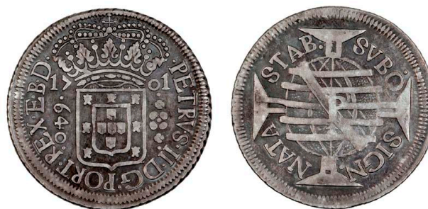
196 D. Pedro II 640 Réis (Duas Patacas) 1701 Pernambuco, REX.E.B.D., prata, AG.25v, MBC+