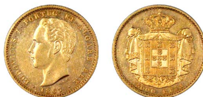
169 D. Luís I 5.000 Réis (Meia Coroa) 1867, ouro, AG.16.01, MBC+