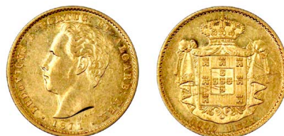
173 D. Luís I 5.000 Réis (Meia Coroa) 1871, ouro, AG.16.05, MBC+