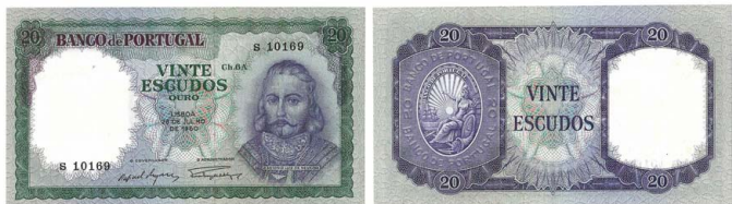
294 Nota de 20 Escudos Ch.6A, 26 de Julho de 1960, S 10169, Pick# 163a, quase nova 15 €