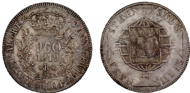
224 D. João VI 960 Réis (Patacão) 1819 Rio de Janeiro, prata, AG.25.06, bela 200 €