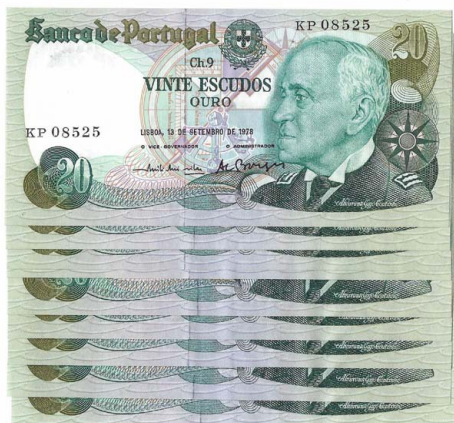
297 Lote de 10 Notas de 20 Escudos Ch.9, 13 de Setembro de 1978, KP 08516-08525, Pick# 176a, quase novas 10 €