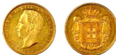
170 D. Luís I 5.000 Réis (Meia Coroa) 1868, ouro, AG.16.02, bela