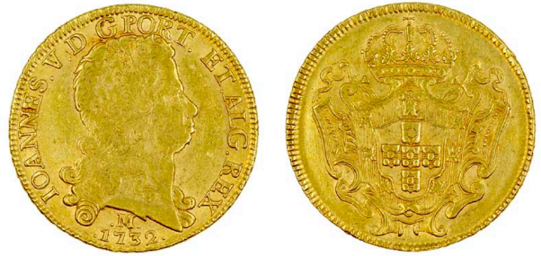
112 D. João V Dobra (12.800 Réis) 1732 Minas Gerais, letra e data entre pontos, ouro, RS.577, AG.140.10, bela 3800 €