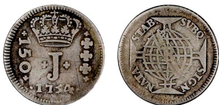
199 D. José I 150 Réis 1754 Bahia, prata, AG.31.03, MBC-