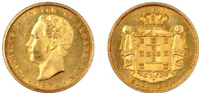
174 D. Luís I 5.000 Réis (Meia Coroa) 1871, ouro, AG.16.05, soberba