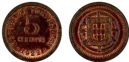
187 5 Centavos 1922, bronze, AG.05.03, envernizada, bela