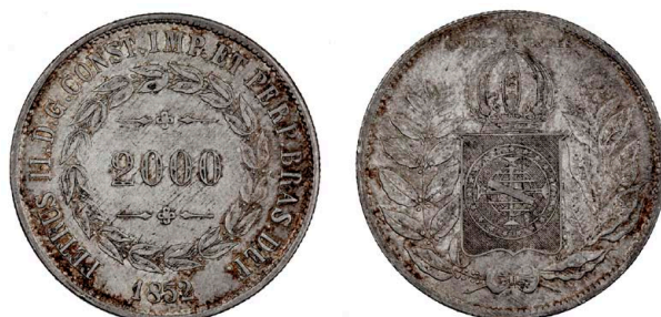
251 D. Pedro II 2.000 Réis 1852, prata, KM#462, MBC+