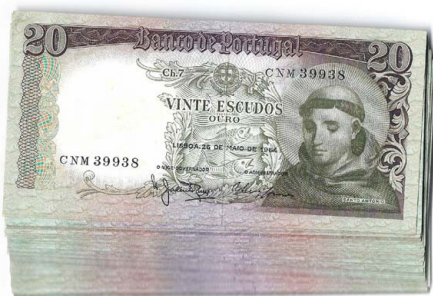
295 Lote de 60 notas de 20 Escudos Ch.7, 26 de Maio de 1964, alguns conjuntos c/ numeração seguida, Pick# 167, bela / quase nova / nova 60 €