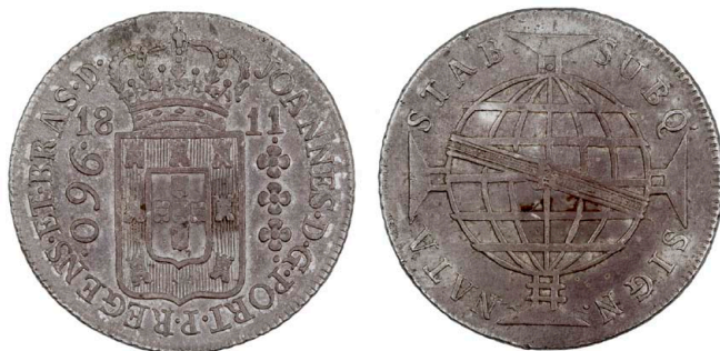
206 D. João Príncipe Regente 960 Réis (Patacão) 1811 Rio de Janeiro, prata, AG.29.06, MBC