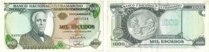
355 Nota de 1.000 Escudos Banco Nacional Ultramarino, 23 de Maio de 1972, 0679554, Pick# 115, MBC+ 10 €