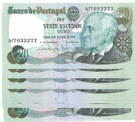
298 Lote de 11 Notas de 20 Escudos Ch.9, 4 de Outubro de 1978, AJT 033277-033287, Pick# 176b, novas 11 €