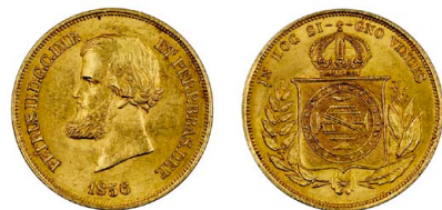
253 D. Pedro II 10.000 Réis 1856, ouro, Neves O646, bela