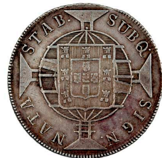
222 D. João VI 960 Réis (Patacão) 1818 Rio de Janeiro, recunhada sobre 8 Reales México, prata, AG.25.01, MBC 120 €