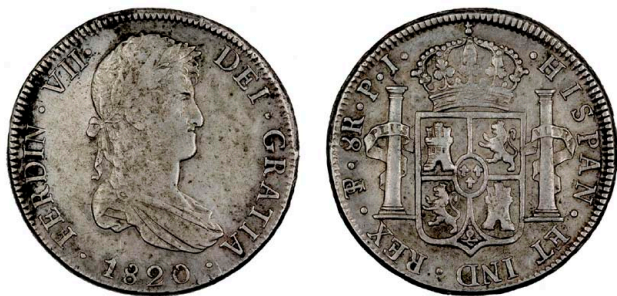
246 Fernando VII 8 Reales 1820 PJ, prata, KM#84, MBC