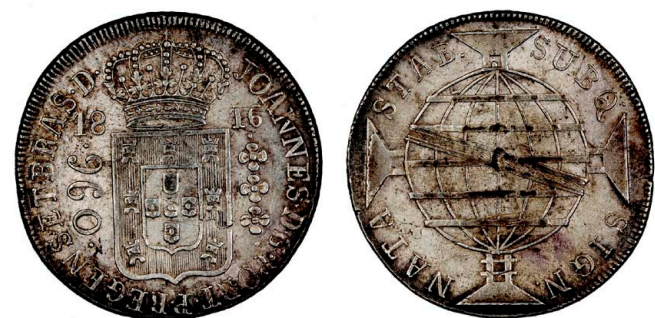
215 D. João Príncipe Regente 960 Réis (Patacão) 1816 Rio de Janeiro, recunhada sobre 8 Reales México 1811 HJ, prata, AG.29.18, MBC 100 €