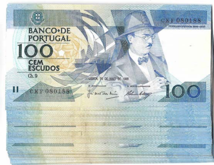
315 Lote de 50 Notas de 100 Escudos Ch.9, 1987 / 1988, Pick# 179, bela / quase nova 50 €