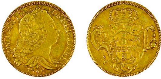
118 D. José I Peça (6.400 Réis) 1756 Bahia, ouro, RS.235, AG.54.07, MBC 1450 €