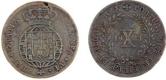
139 D. João VI X Réis 1823, cobre, AG.03.08, MBC