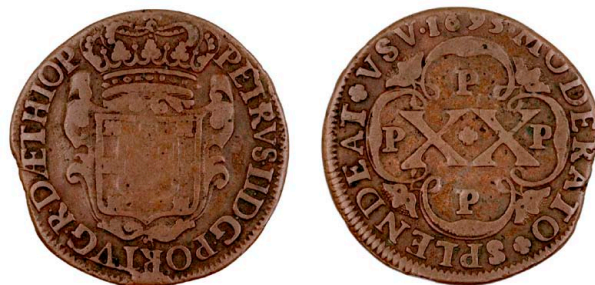
193 D. Pedro II XX Réis 1695, PPPP, cobre, AG.03.03, MBC