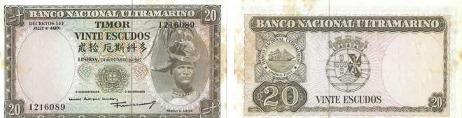
358 Lote de 2 Notas de 20 Escudos Banco Nacional Ultramarino, 24 de Outubro de 1967, numeração seguida 1216089/90, Pick# 26, manchas, belas 5 €