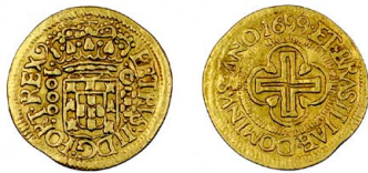
197 D. Pedro II 1.000 Réis (1/4 de Moeda) 1699, ouro, AG.26.01, MBC