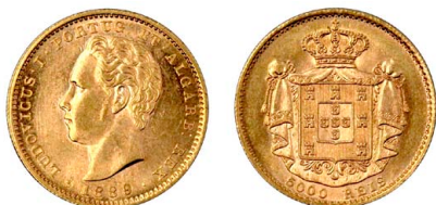
180 D. Luís I 5.000 Réis (Meia Coroa) 1889, ouro, AG.16.08, soberba