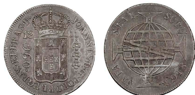
207 D. João Príncipe Regente 960 Réis (Patacão) 1811 Rio de Janeiro, prata, AG.29.06, MBC