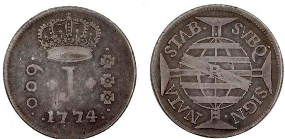
201 D. José I 600 Réis 1774 Rio de Janeiro, zonas rectas, prata, AG.50.03, MBC-