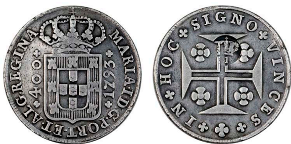
190 Carimbo GP Coroado de D. Luís I sobre Cruzado de D. Maria I de 1793 (600 Réis Cruzados), prata, AG.14.04, MBC