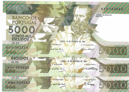
332 Lote de 3 Notas de 5.000 Escudos Ch.2A, 19 de Outubro de 1989, BFN 062519, BNF 033622, BMR 003342, Pick# 184b, quase novas 90 €