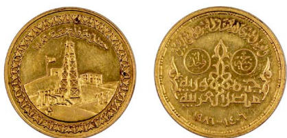
258 1 Pound 1986, Centésimo Aniversário da Descoberta do Petróleo no Egito, ouro, KM# 638, bela