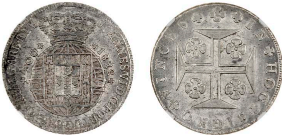
141 D. João VI Cruzado (480 Réis) 1822, coroa baixa, prata, AG.12.05, NGC 667333-004, MS 63

NGC Numismatic Guaranty Corporation 250 €