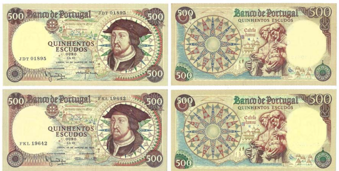
316 Lote de 2 Notas de 500 Escudos Ch.10, 25 de Janeiro de 1966, FKL 19642, JDT 01895, Pick#170a, bela / quase nova 20 €