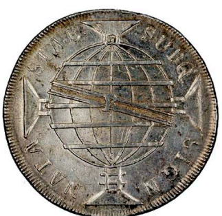
217 D. João Príncipe Regente 960 Réis (Patacão) 1817 Rio de Janeiro, disco maior, prata, AG.29.20, MBC 130 €