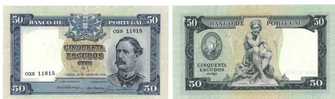
300 Nota de 50 Escudos Ch.7, 24 de Junho de 1955, CGN 11615, Pick# 160, bela 35 €