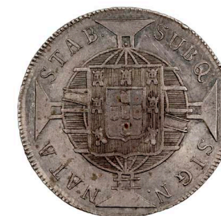
223 D. João VI 960 Réis (Patacão) 1818 Rio de Janeiro, recunhada sobre 8 Reales 1817, prata, AG.25.01, MBC 100 €