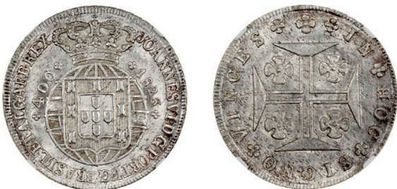
142 D. João VI Cruzado (480 Réis) 1823, coroa alta, algarismos pequenos, prata, AG.12.17, NGC 667333-005, MS 63