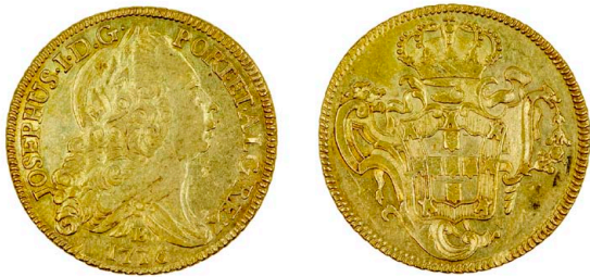
119 D. José I Peça (6.400 Réis) Bahia 1776, JOSEPHUS, ouro, AG.54.29, MBC 900 €