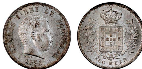
185 D. Carlos I 500 Réis (5 Tostões) 1893, prata, AG.11.05, bela