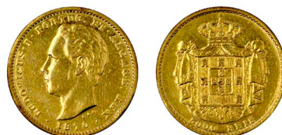
172 D. Luís I 5.000 Réis (Meia Coroa) 1870, ouro, AG.16.04, MBC-