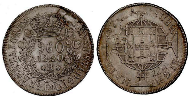
226 D. João VI 960 Réis (Patacão) 1820 Rio de Janeiro, recunhado sobre 8 Reales Lima 1820 JP, prata, AG.25.10, MBC 120 €