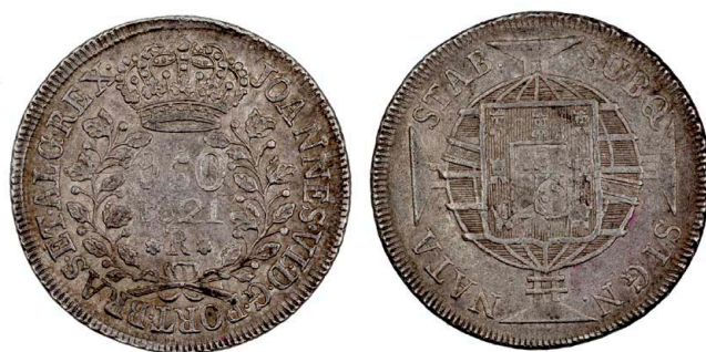
229 D. João VI 960 Réis (Patacão) 1821 Rio de Janeiro, disco maior, prata, AG.25.20, MBC+ 160 €