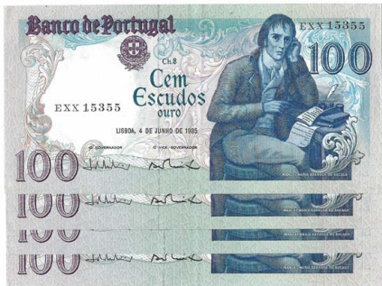
312 Lote de 4 Notas de 100 Escudos Ch.8, 4 de Junho de 1985, numeração seguida EXX 15352-5, Pick# 178e, belas 5 €