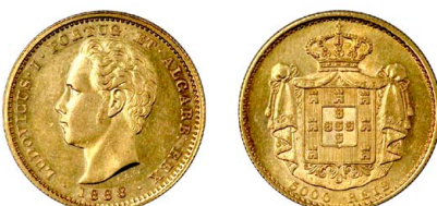
178 D. Luís I 5.000 Réis (Meia Coroa) 1888, ouro, AG.16.17, soberba