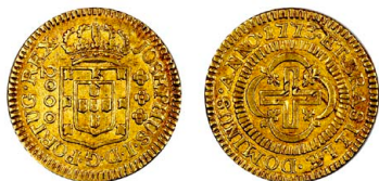
202 D. José I 2.000 Réis (1/2 de Moeda) 1773, JOSEPHUS.../...DOMINUS, eixo horizontal, ouro, AG.62.05, MBC+