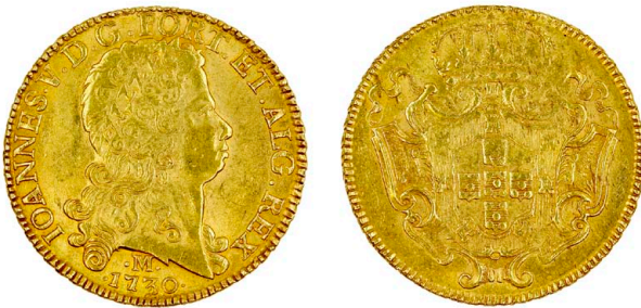
109 D. João V Dobra (12.800 Réis) 1730 Minas Gerais, ouro, RS.576V, AG.140.08v, bela 4300 €