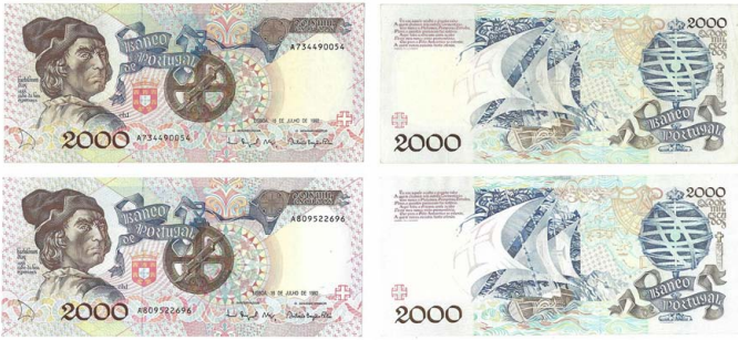
327 Nota de 2.000 Escudos Ch.1, 16 de Julho de 1992, A809522696, A734490054, Pick# 186c, belas 20 €