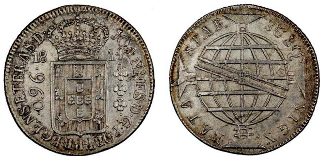
210 D. João Príncipe Regente 960 Réis (Patacão) 1814 Rio de Janeiro, prata, AG.29.14, MBC 100 €