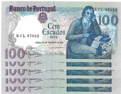
311 Lote de 5 Notas de 100 Escudos Ch.8, 24 de Fevereiro de 1981, numeração seguida B.J.L. 97822-6, Pick# 178b, quase novas 10 €