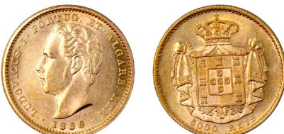
179 D. Luís I 5.000 Réis (Meia Coroa) 1889, ouro, AG.16.08, soberba