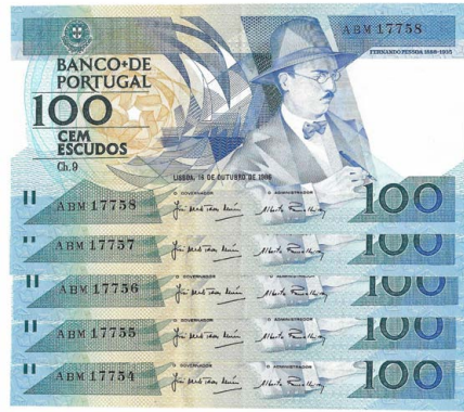
314 Lote de 5 Notas de 100 Escudos Ch.9, 16 de Outubro de 1986, numeração seguida ABM 17754-8, Pick# 179a, belas 10 €