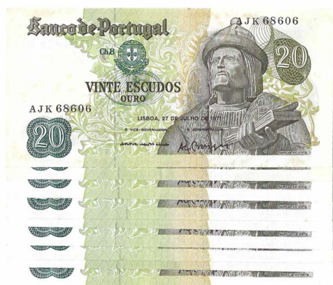
296 Lote de 9 Notas de 20 Escudos Ch.8, 27 de Julho de 1971, AJK, alguns pares seguidos, Pick# 173, bela / quase nova / nova 10 €