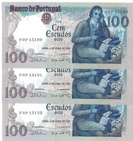
313 Lote de 3 Notas de 100 Escudos Ch.8, 4 de Junho de 1985, numeração seguida FBP 15190-2, Pick# 178e, quase novas 5 €