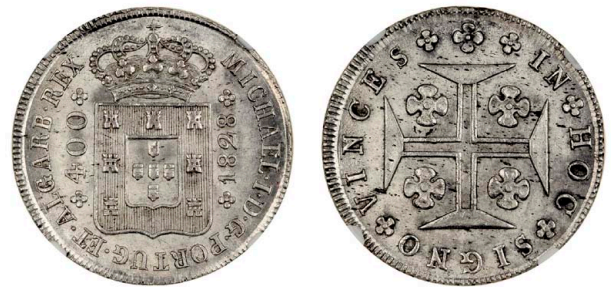
145 D. Miguel I Cruzado (480 Réis) 1828, coroa larga, prata, AG.12.01, NGC 667333-002, MS 63

NGC Numismatic Guaranty Corporation 250 €