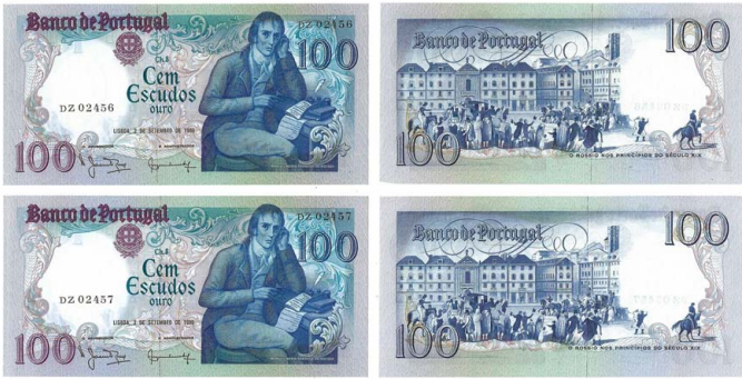
310 Lote de 2 Notas de 100 Escudos Ch.8, 2 de Setembro de 1980, numeração seguida DZ 02456/7, Pick# 178a, novas 10 €