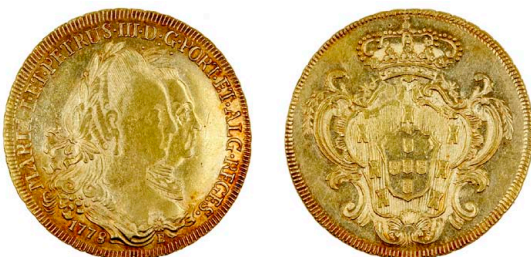
122 D. Maria I e D. Pedro III Peça (6.400 Réis) 1778 Bahia, B afastado da data, ponto no final da legenda, ouro, AG.28.02, MBC+ 1000 €