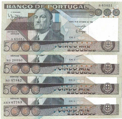
329 Lote de 4 Notas de 5.000 Escudos Ch.1, 1980-81-83-85, Pick#182, belas 125 €