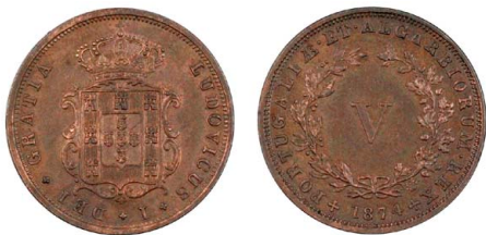
161 D. Luís I V Réis 1874, cobre, AG.02.06, bela