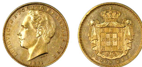
182 D. Luís I 10.000 Réis 1881, ouro, AG.17.06, rev. c/ ligeira moessa na serrilha, MBC+