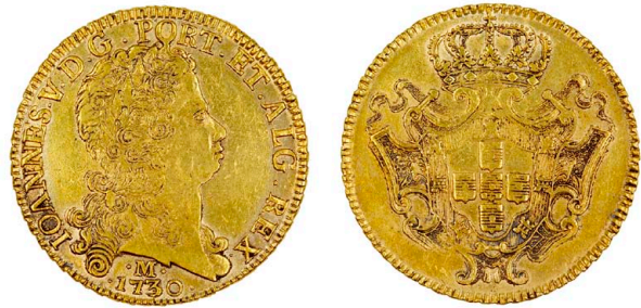
108 D. João V Dobra (12.800 Réis) 1730 Minas Gerais, ouro, RS.575, AG.140.07, MBC+ 4000 €