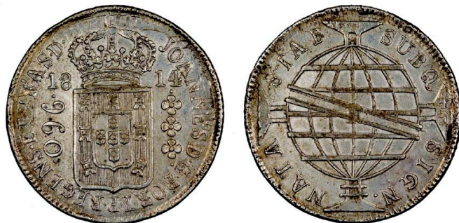
212 D. João Príncipe Regente 960 Réis (Patacão) 1814 Rio de Janeiro, prata, AG.29.14, MBC 120 €