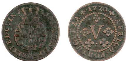
191 D. José I V Réis 1770 (Pano), cobre, AG.05.01, MBC