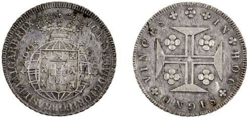
140 D. João VI 12 Vinténs (240 Réis) 1820, prata, cruz irradiada, AG.11.06, bela