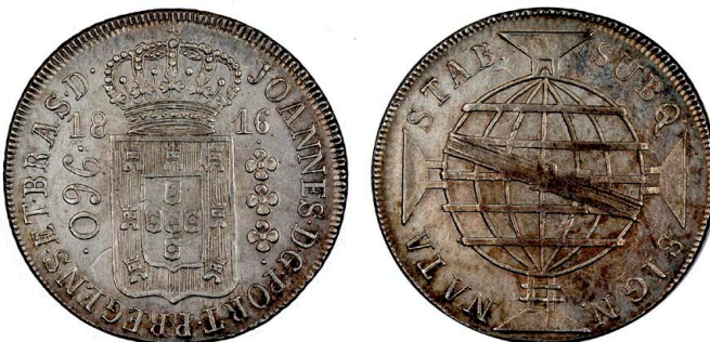
214 D. João Príncipe Regente 960 Réis (Patacão) 1816 Rio de Janeiro, PREGENS, recunhada sobre 8 Reales México 1799 FM, prata, AG.29.18v, MBC 110 €