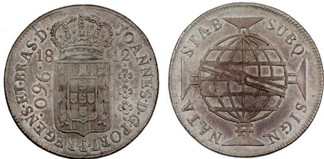
208 D. João Príncipe Regente 960 Réis (Patacão) 1812 Rio de Janeiro, data emendada 2/1, prata, AG.29.08, MBC 120 €