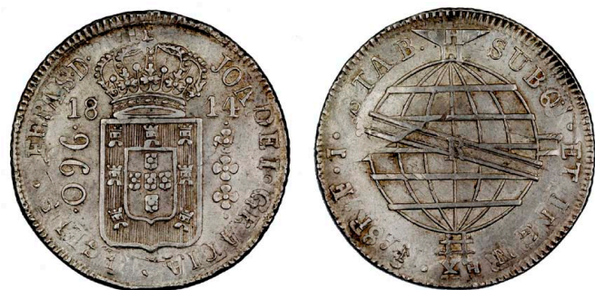
213 D. João Príncipe Regente 960 Réis (Patacão) 1814 Rio de Janeiro, recunhada sobre 8 Reales Santiago 1811 FJ, prata, AG.29.14, MBC 170 €