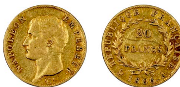
262 Napoleão 20 Francos 1806 A, ouro, KM# 674.1, MBC-