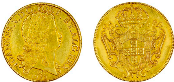
113 D. João V Dobra (12.800 Réis) 1733 Minas Gerais, M e data entre pontos, ouro, RS.578, AG.140.11, bela 5500 €