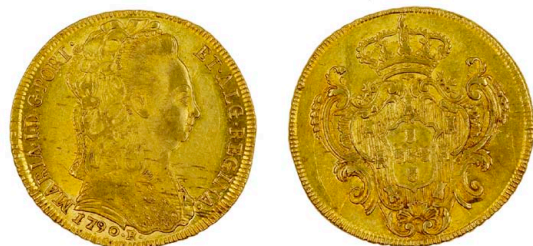
128 D. Maria I Peça (6.400 Réis) 1790 Rio de Janeiro, ponto no final da legenda, ouro, RS.117, AG.33.02, bela 1100 €