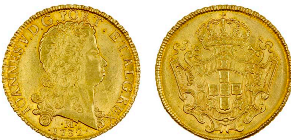
111 D. João V Dobra (12.800 Réis) 1732 Minas Gerais, M e data entre pontos, ouro, RS.577, AG.140.10, q. soberba 4500 €