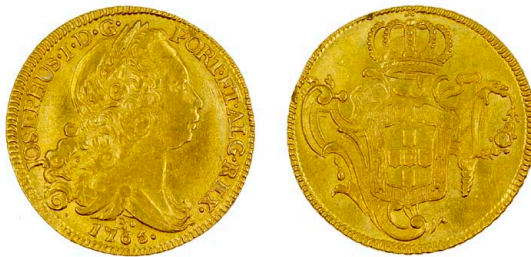
120 D. José I Peça (6.400 Réis) 1765 Rio de Janeiro, ouro, RS.235, AG.54.07, bela 990 €