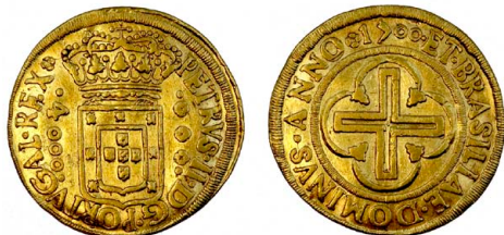
198 D. Pedro II 4.000 Réis 1700 Rio de Janeiro, ouro, "PORTUGAL", CA.032B, MBC+