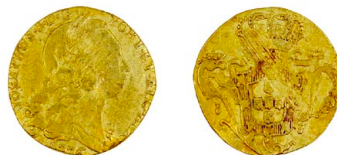
116 D. José I Escudo (1.600 Réis) 1776, JOSEPHUS, ouro, AG.47.06, cerceada, BC 150 €