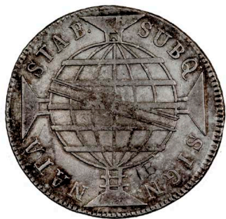
216 D. João Príncipe Regente 960 Réis (Patacão) 1816 Rio de Janeiro, Série Especial, prata, AG.29.18, MBC 360 €