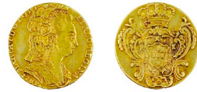
124 D. Maria I Meio Escudo (800 Réis) 1789, toucado, ouro, AG.22.01, cerceada, BC+ 175 €