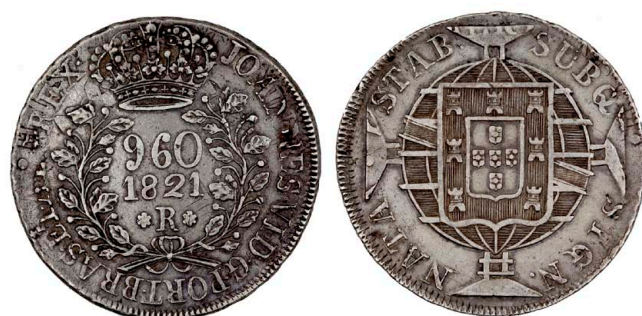
230 D. João VI 960 Réis (Patacão) 1821 Rio de Janeiro, 9 frutos no ramo direito, prata, AG.25v, MBC 200 €