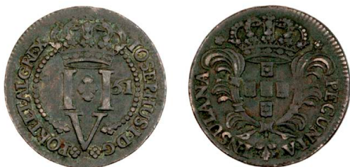
188 D. José I V Réis 1751, cobre, AG.01.02, MBC