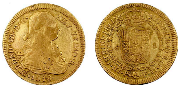
257 Fernando VII 8 Escudos 1818 FM, Popayán, ouro, Calicó 1823, MBC-