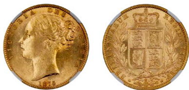
244 Victoria Libra 1875 S (Sydney), ouro, Marsh 72, NGC 6637337-007, AU 55