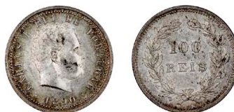
184 D. Carlos I 100 Réis (Tostão) 1890, prata, AG.06.01, bela