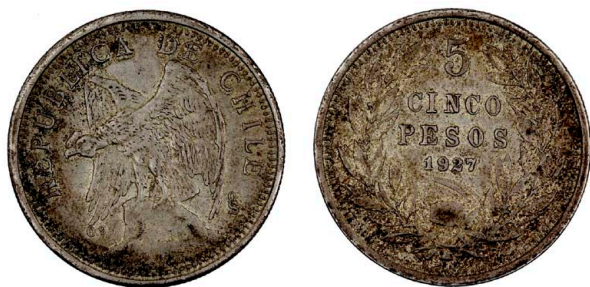
256 5 Pesos 1927, prata, KM#173L, MBC+