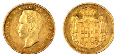
171 D. Luís I 5.000 Réis (Meia Coroa) 1869, ouro, AG.16.03, bela