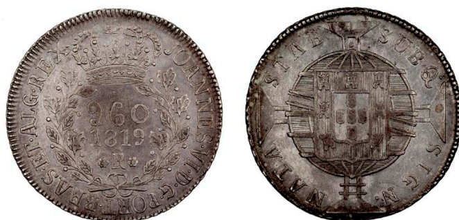
225 D. João VI 960 Réis (Patacão) 1819 Rio de Janeiro, recunhada sobre 8 Reales México JJ, prata, AG.25.06, MBC+ 120 €