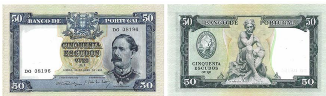
299 Nota de 50 Escudos Ch.7, 28 de Abril de 1953, DG 08196, Pick# 160, quase nova 50 €