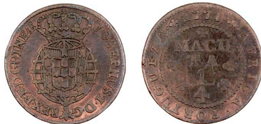
192 D. José I 1/4 Macuta 1771, cobre, AG.06.06, MBC