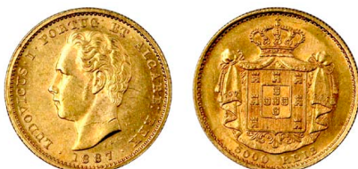
177 D. Luís I 5.000 Réis (Meia Coroa) 1887, ouro, AG.16.16, bela