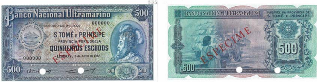
356 Nota de 500 Escudos Banco Nacional Ultramarino, 18 de Abril de 1956, ESPÉCIME, 000000, Pick# 39s, nova 75 €