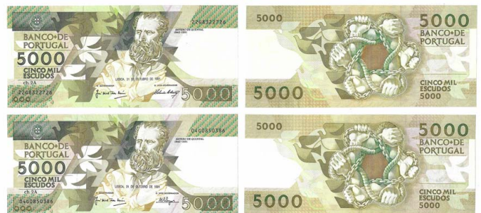
334 Lote de 2 Notas de 5.000 Escudos Ch.2A, 31 de Outubro de 1991, 04G0850386, 22G8322726, Pick# 184d, belas 60 €