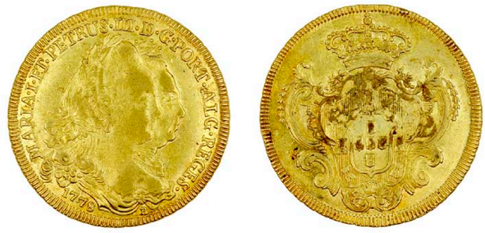
123 D. Maria I e D. Pedro III Peça (6.400 Réis) 1778 Bahia, ponto no final da legenda, ouro, RS.81, AG.28.02, bela 1500 €