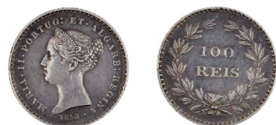
147 D. Maria II Tostão (100 Réis) 1838, data emendada 8/6, prata, AG.35.02, MBC