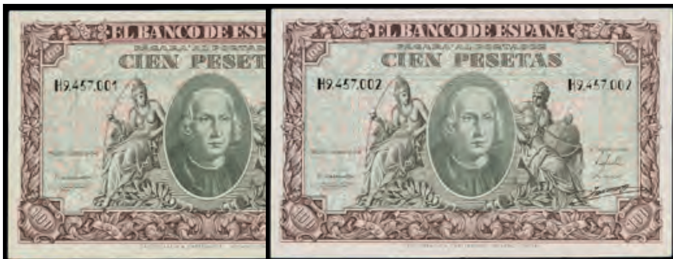
1562 1940. 100 pesetas. (Ed. 438a). 9 de enero, Colón. Pareja correlativa, serie H. Doblez central y márgenes rozados en ambos ejemplares. MBC+ . Est. 60 30.-