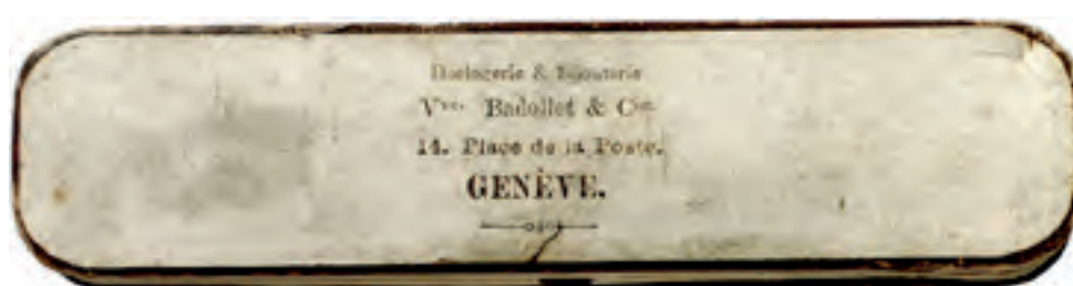
1552 (s. XIX). Collarín de solapa de la Real y Distinguida Orden Española de Carlos III. En estuche alargado de la joyería Vve. Badollet & Cie. GINEBRA. Muy raro. Oro y esmaltes. 22,79 g. S/C. Est. 2.500