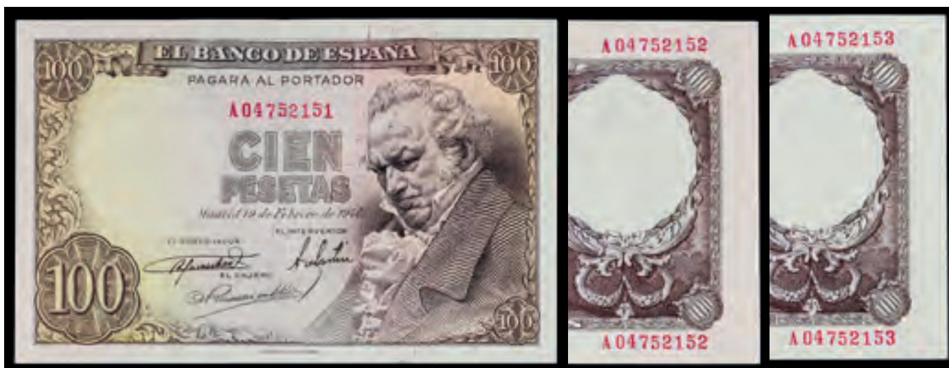
1564 1946. 100 pesetas. (Ed. 451a). 19 de febrero, Goya. Trío correlativo, serie A. Leve ondulación central. Apresto original. EBC+ . Est. 150 90.-