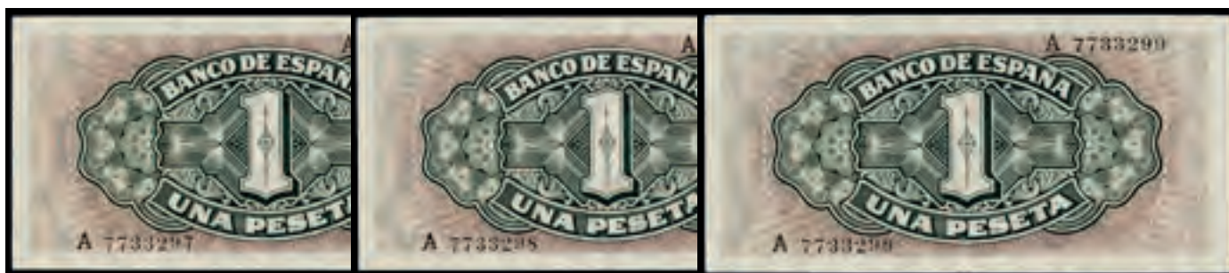
1563 1940. 1 peseta. (Ed. 442a). 4 de septiembre, "Santa María". Trío correlativo, serie A. Buenos ejemplares. Apresto original. S/C- . Est. 90 60.-