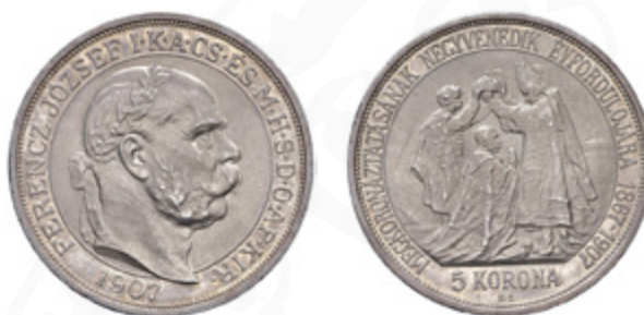
423 Franz Joseph I (1848-1916) 5 Corone 1907 “ 40° Anniversario dell'incoronazione di Franz Joseph - KM 489 Ag 24,41 g