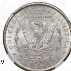
424 USA Dollaro Morgan 1880 S, zecca di San Francisco - KM 110 Ag • In slab NGC MS 66 n. 6636874-001.