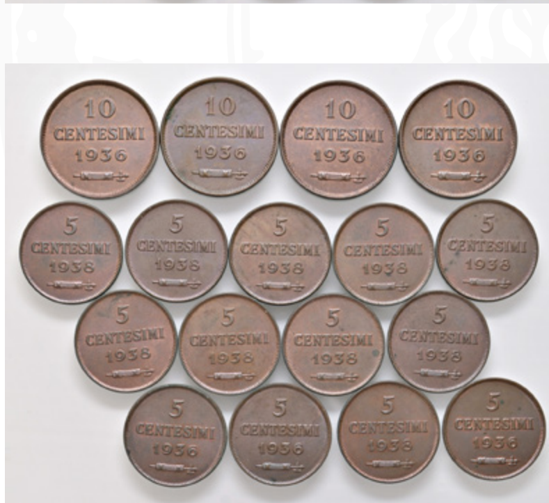
344 Vecchia monetazione (1864-1938) 10 Centesimi 1936 (4), 5 centesimi 1936 (3), 5 Centesimi 1938 (10) - Gig. 34, 41, 43 Cu • Insieme di 17 monete.